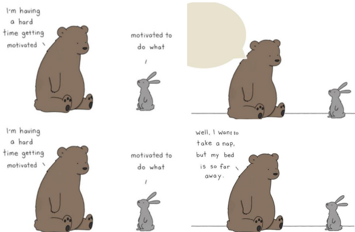
Рис. 5. Приклад завдання для формування мовленнєвих навичок

Ще одним варіантом вправи може бути виконання завдання на встановлення правильної послідовності реплік. Якщо дане завдання виконується на дистанційному навчанні, то для зручності виконання, можна використати Jamboard (онлайн дошка), де студенти можуть редагувати запропоновані викладачем репліки. Якщо дане завдання виконувати аудиторно, то студентів можна поділити на команди, щоб вони вибудували репліки у правильній послідовності, дотримуючись граматичних правил та правил пунктуації (рис. 6). Під час виконання завдання можна встановити ще ліміт часу. По завершенню виконання, перевіряємо отримані варіанти відповідей та звіряємо з оригіналом коміксу (All Right, 2023).