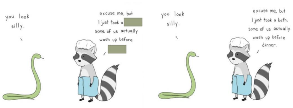
Рис. 3. Приклад завдання із використанням коміксу для заповнення пропусків

Комікси також можна використовувати для навчання граматики. Студентам можна запропонувати виконати завдання на основі коміксу, де їм потрібно буде вжити дієслово у певній часовій формі (рис. 4), або навпаки, вжити в реченні певну граматичну структуру, а студенти мають зрозуміти її значення із контексту.