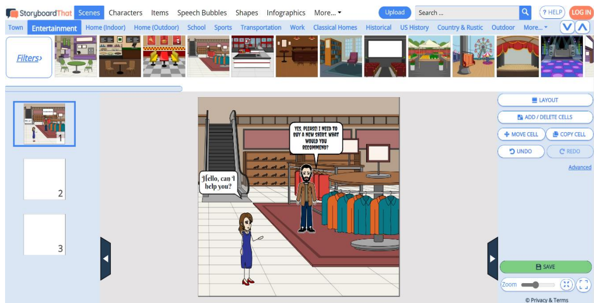
Рис. 1. Приклад меню ресурсу для створення коміксу

Розглянемо способи створення коміксів за допомогою інтернет-ресурсів, використавши вебсайт https://www.storyboardthat.com/storyboard-creator . Він має дуже широкий асортимент опцій, які можна використовувати для створення коміксу. Як бачимо з меню сайту, можна обрати задній фон, видозмінити головних героїв, обрати бульбашки різної форми. Якщо переходимо безпосередньо до роботи з текстом, то його можна писати різними шрифтами, різним розміром та кольором (рис. 1).