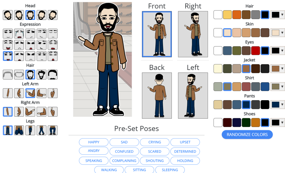
Рис. 2. Приклад створення образу героя коміксу

Використання цього сайту має певні недоліки. Якщо ви не бажаєте реєструватися на сайті, то вам буде надано лише три безкоштовні панелі для створення коміксу. Відповідно також зменшується можливість вибору персонажів та заднього фону. Ви не зможете зберегти створений вами комікс, єдиний можливий варіант – робити скріншоти зображення та зберігати на пристрої. Якщо ви реєструєтесь на сайті, то перед вами відкривається широкий спектр можливостей для створення коміксів.