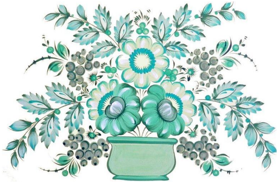
Рис. 1. Дзеркальна симетрія в композиції