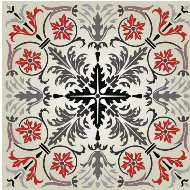
Рис. 2. Точкова (центрова) симетрія в композиції

Ще одним різновидом симетрії є динамічна симетрія, яка утворюється в результаті симетрії двох елементів, що протистоять один одному, розташовані окремо і мають між собою видиме тяжіння і напругу (рис. 3).