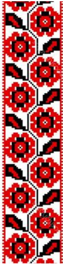
Рис. 3. Динамічна симетрія