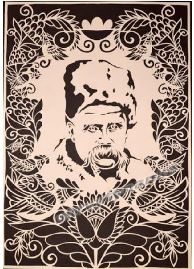
Рис. 4. Асиметрія в композиції

Часто використовуваним та ефектним засобом композиції є контраст (рис. 5, а-д), який становить поєднання протилежного, взаємовигідне протиставлення фрагментів, різнойменних за своїми характеристиками. Контраст як універсальний засіб допомагає створити яскравий і виразний твір. Значення контрастів у композиції відоме з давніх-давен. Леонардо да Вінчі в «Трактаті про живопис» говорив про необхідність використання контрасту величин (високе-низьке, велике-маленьке, товсте-тонке), фактур, матеріалів, об'ємів, площин. Мікеланджело домагався такої потужної об'ємності своїх фігур завдяки поєднанню їх з площиною, тобто з контрастом. Контраст може виражатися в кольорі, в тоні, в протиставленні ламаних і плавних ліній, деталізованих і недеталізованих елементів. Тоді якість елементів стає яскравішою, загострюється під час порівняння, а предмети при цьому відображають взаємодію, композиційний взаємозв'язок. Декоративне ціле композиції також будується на виразному контрасті – найчастіше світлої плями на темному тлі або темного на світлому.