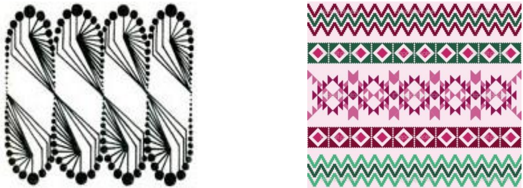
Рис. 6. Ритм у композиції

Характер композиції визначається ритмом (рис. 6) – одним з найважливіших композиційних засобів. Взаємодія форми, текстури, кольору, тону, розмірів елементів створює певний ритм, темп. Ритм – це закономірне повторення або чергування елементів композиції, що сприяє досягненню її ясності, виразності і чіткості сприйняття. Ритму підпорядкований порядок, зв'язок, лад всіх елементів твору. Ритмічний розвиток композиції може здійснюватися по горизонталі або по вертикалі, по квадрату або по колу, по спіралі або по сітці, але у всіх випадках ритм залишається організуючим та естетичним началом в композиції.