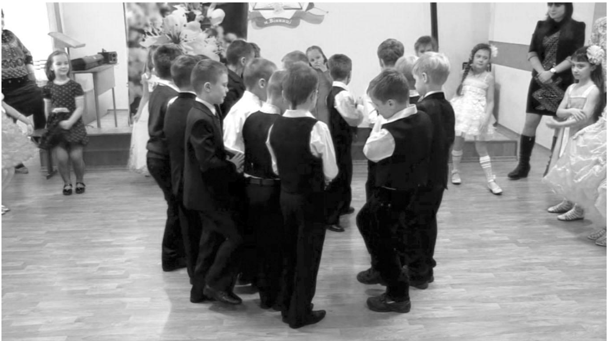
Інсценізація казки учнями 1-А класу “Білосніжка та семеро гномів”