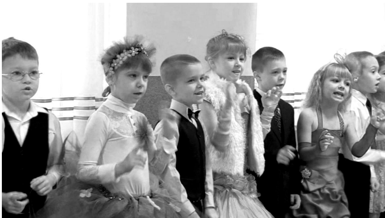
Виконання ансамблем пісня Н. Май “Там, де мама і я, там і сходить зоря” учнями 3-А класу