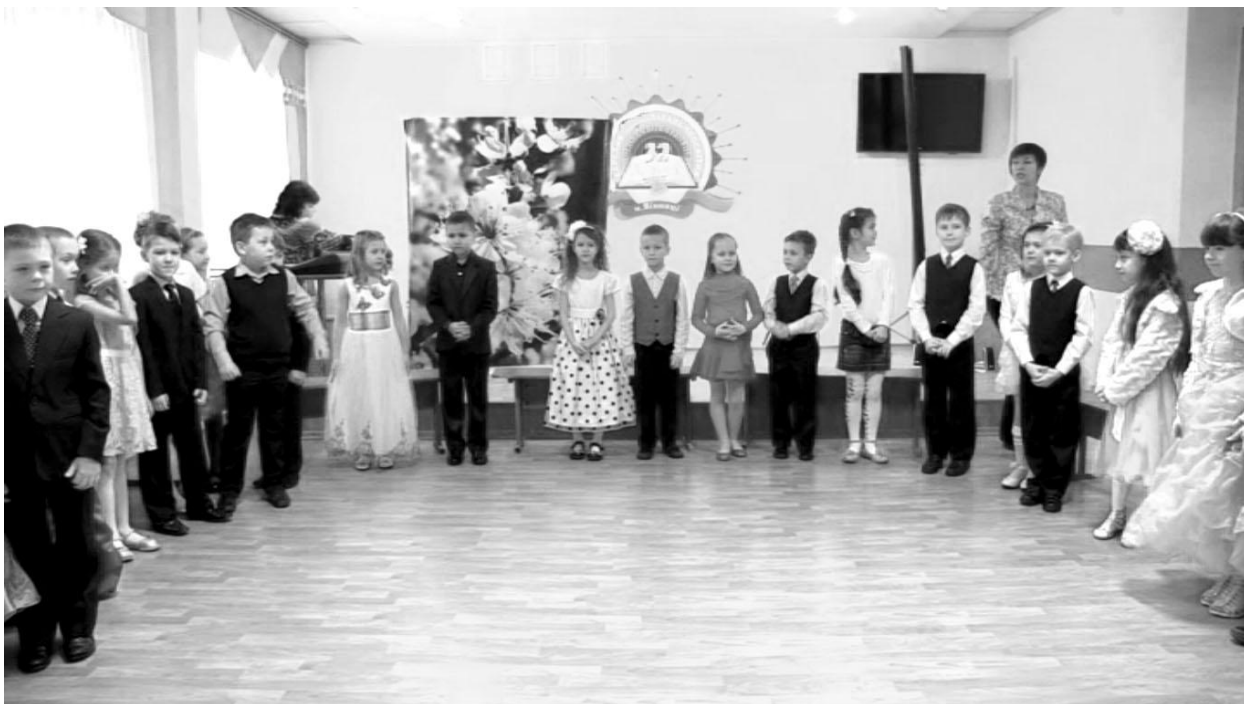
Вітання батьків учнями 1-А класу “Свято наших мам – 8 Березня”