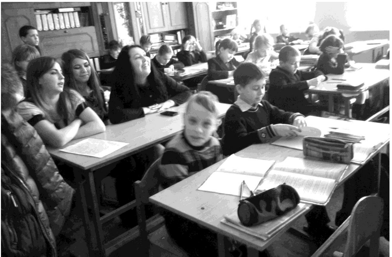
Вивчення теми “Варіаційний розвиток музики” учнями 3-А класу