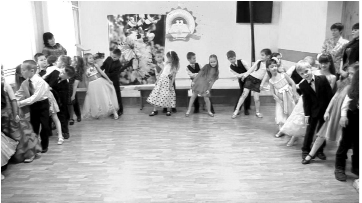
Вальс для наших любих мам у виконанні учнів 1-А класу