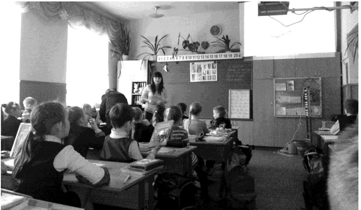
Виконання творчого завдання учнями 3-А класу: прослухати музичний твір і розповісти уявну картину