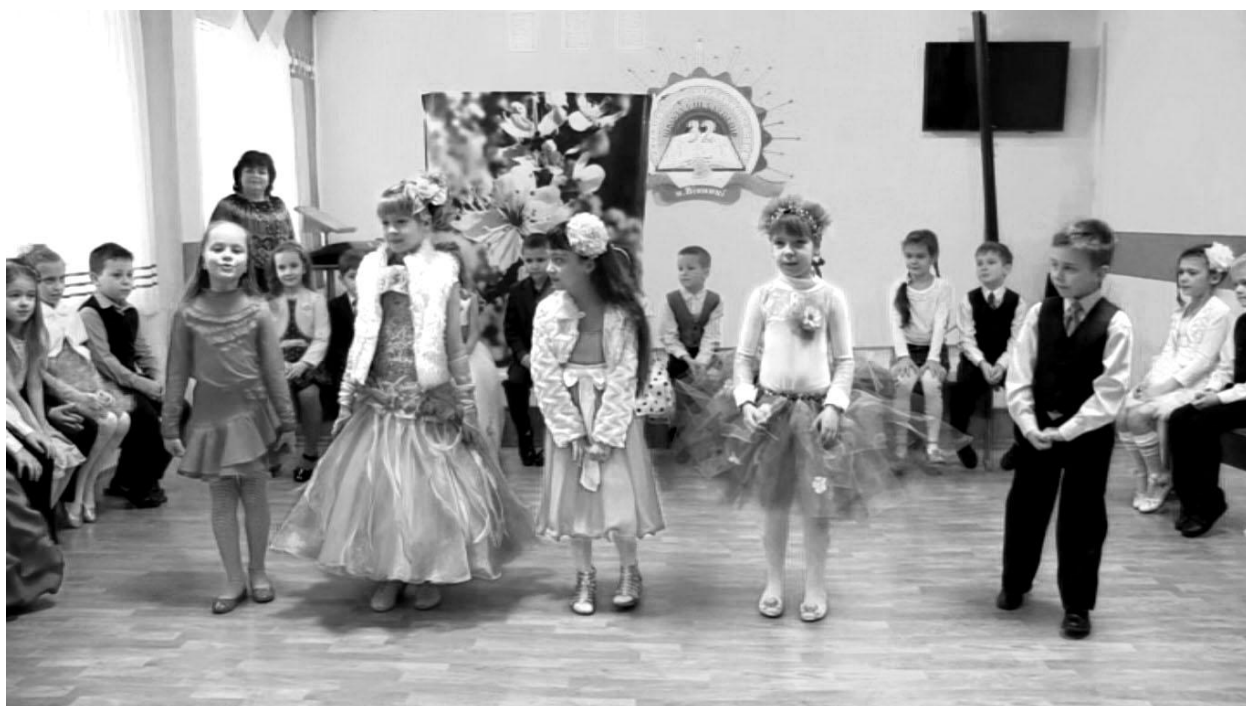
Учні 3-А класу дарують поезію мамам “Свято сяє квіточками, гріє сонечко весни, свято це є свято мами, в день чарівний і ясний”