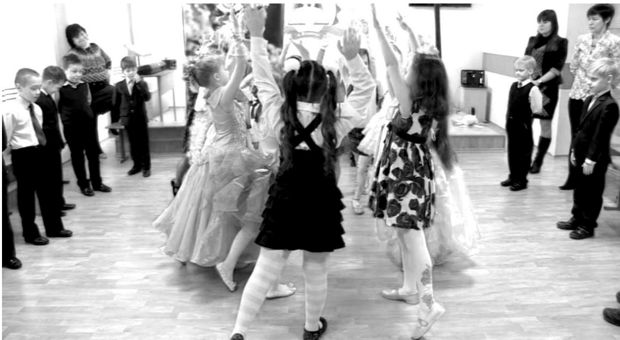
“Ми танцюєм і співаєм – Україну прославляєм” свято інсценізованої пісні учнями 1-А класу