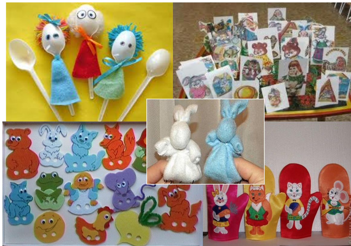
Рис. 2.3.1. Ляльки для театралізованої діяльності дітей молодшого дошкільного віку

Знайомство з театральною лялькою ми розпочинали з невеликої гри драматизації, яку демонстрував вихователь. Діти із цікавістю, інколи навіть зачаровано слухали віршик або забавлянку чи уривок казки у показі актора-ляльки, яку водив вихователь. Вони сприймали вихователя за реального зайчика чи ведмедика. Згодом діти розглядали, приміряли та намагалися оживати та озвучити обрану ляльку, наслідували ходу, звуки, навіть інтонації голосу обраного героя. Ми залучали спочатку найактивніших та сміливіших вихованців до показу окремих дій у театралізованих іграх-імітаціях чи етюдах-завданнях, організовували гру «Театр». Вчили дітей інсценізувати окремі сценки за змістом знайомих літературних творів. Ми намагалися розвинути в малят елементарні навички володіння мовою жестів, вчили емітувати рухи людей та тварин (персонажів ігр-драматизацій), передавати мімікою певний емоційний стан людини.