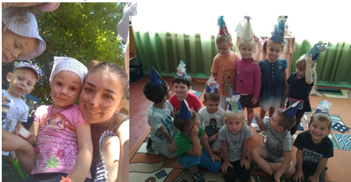
Рис.2.3.1. Процес підготовки до вистав для батьків

Театр має бути для дітей. Тому у своїй практиці ми керувались принципом: вистави мають стати справжнім святом для дітей. В театрі, де акторами є діти, найважливішим є факт гри. Не потрібно намагатися досягти відсоткової злагодженості й акторської віддачі. Насамперед потрібно організувати театр для акторів, а вже потім – для глядачів. Ось чому першими глядачами мають стати найрідніші та найвдячніші люди – батьки та родичі дошкільників (рис. 2.3.1).