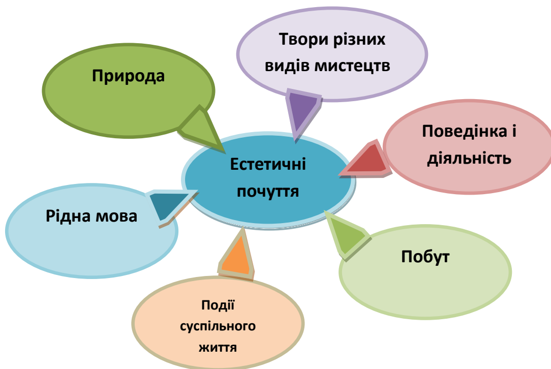
Рис.1.1. Засоби виховання естетичних почуттів дітей дошкільного віку

Виняткову роль в естетичному вихованні дошкільників відіграють заняття естетичного спрямування: малювання, ліплення, аплікація, конструювання, музичні та фізичні заняття). На таких заняттях діти не тільки здобувають теоретичні знання з різних видів мистецтв, а й набувають конкретних практичних умінь та навичок, розвивають свої мистецькі здібності