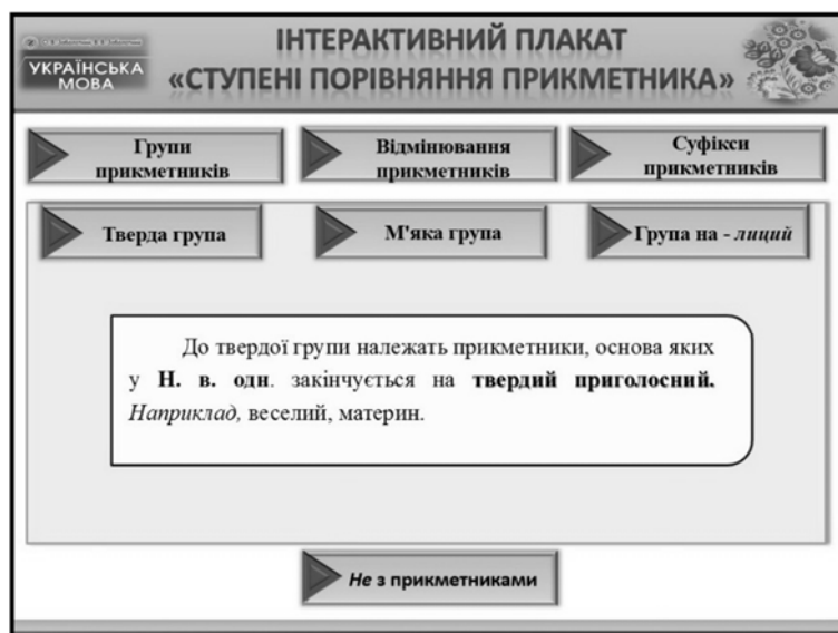
Рис. 3. Інформаційний слайд інтерактивного плаката

Головний слайд у вигляді ключових слів репрезентує виклад основного матеріалу з теми. У цьому випадку ми розглянемо: групи прикметників, відмінювання прикметників, суфікси прикметників та проаналізуємо написання не з прикметниками.