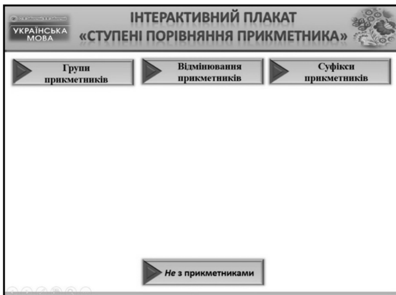
Рис. 2. Головний слайд інтерактивного плаката

На цьому слайді функцію інтерактивного засобу виконує маркер у вигляді стрілки, що дає змогу перейти до викладу основного матеріалу, який розташований на головному слайді.