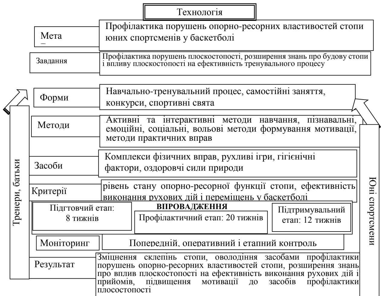
Рис. 1. Технологія профілактики порушень опорно-ресорних властивостей стопи юних спортсменів у баскетболі [10]

Розроблена технологія ґрунтується на наступних концептуальних положеннях: