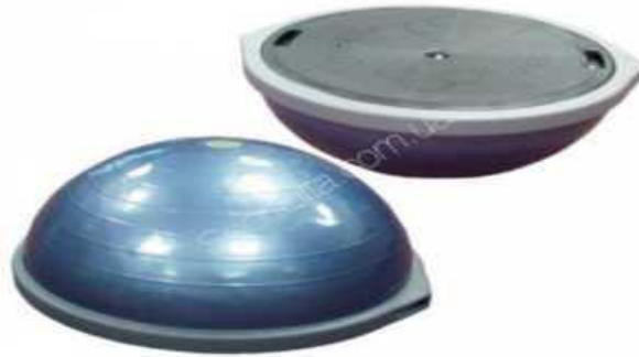
Рис. 2.3. Балансувальна платформа БОСУ

У діаграмах наочно відбивають й аналізують масові дані. У курсових роботах найчастіше використовують стовпчикові діаграми (площинні й об'ємні). На стовпчикових діаграмах дані зображуються у вигляді прямокутників (стовпчиків) однакової ширини, розміщених вертикально або горизонтально. Наприклад: