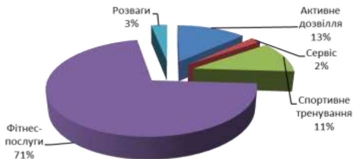
Рис. 2. Структура попиту на групи послуг серед жінок спортивного клубу «MAXIMA»

В результаті дослідження нами було виявлено, що попит на фізкультурно-спортивні послуги серед чоловіків має дещо незвичну структуру. Фітнес-послуги становлять 39%, тоді, як спортивне тренування – 3%. Це відрізняється від даних, представлених у науково-методичній літературі. Активне дозвілля становить 23%, розваги – 26%. Таким чином, структура попиту дає можливість коректувати стратегію спортивного клубу «MAXIMA». Дещо інші показники виявили серед жіночого населення (рис. 2).