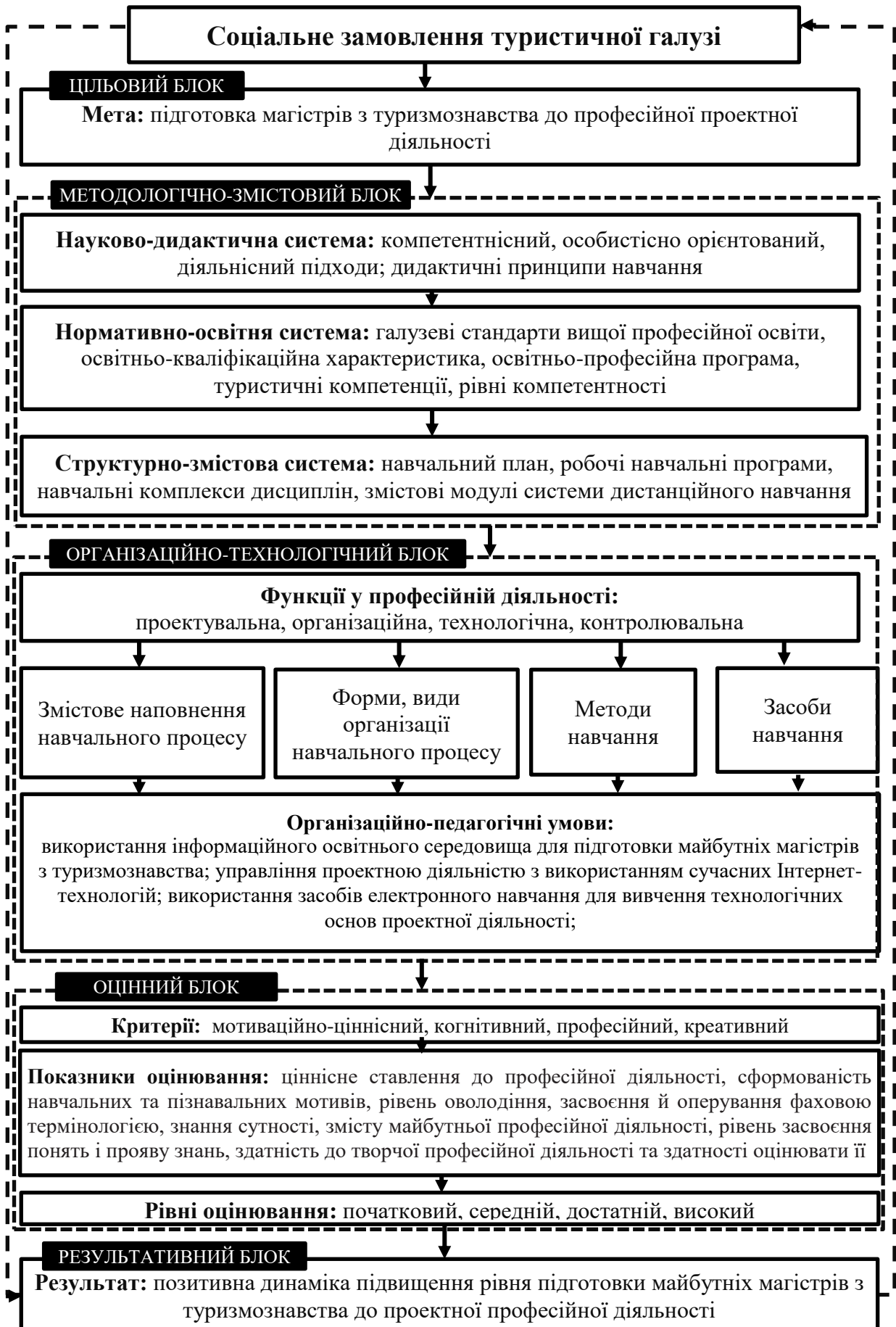
Рис. 1. Модель підготовки майбутніх магістрів з туризмознавства до проектної професійної діяльності