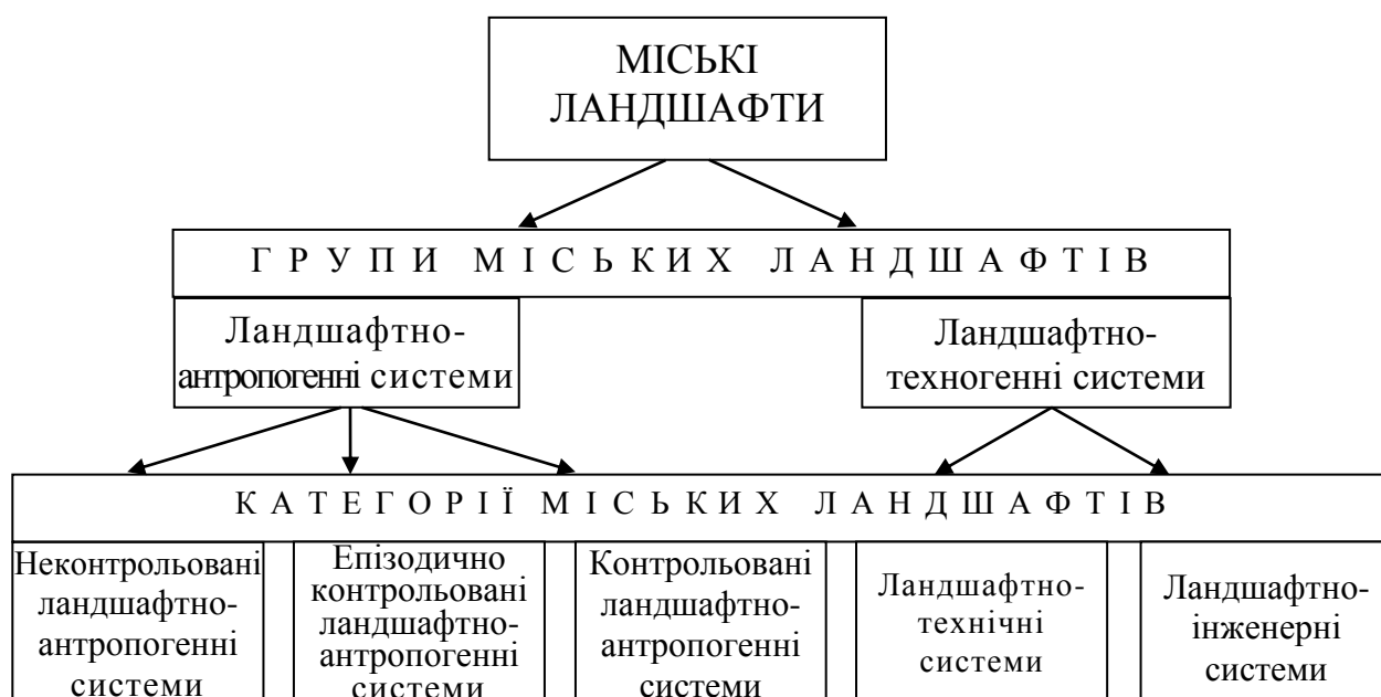
Рис. 1 Групи та категорії міських ландшафтів

ландшафтний та соціальний. Перший представлений комплексом докорінно змінених компонентів, другий - різними верствами населення, яке проживає, працює та відпочиває у ландшафтному комплексі. Епізодично контрольовані ЛАС контролюються та доглядаються людиною епізодично. У контрольованих ландшафтно-антропогенних системах ландшафтний блок контролюється та доглядається людиною, здійснюється регулювання деяких природних процесів. У межах ландшафтно-антропогенних систем, на відміну від ландшафтно-техногенних систем (ЛТС), техногенний покрив не має фонового значення. Всі міські ЛАС розвиваються переважно за природними закономірностями.