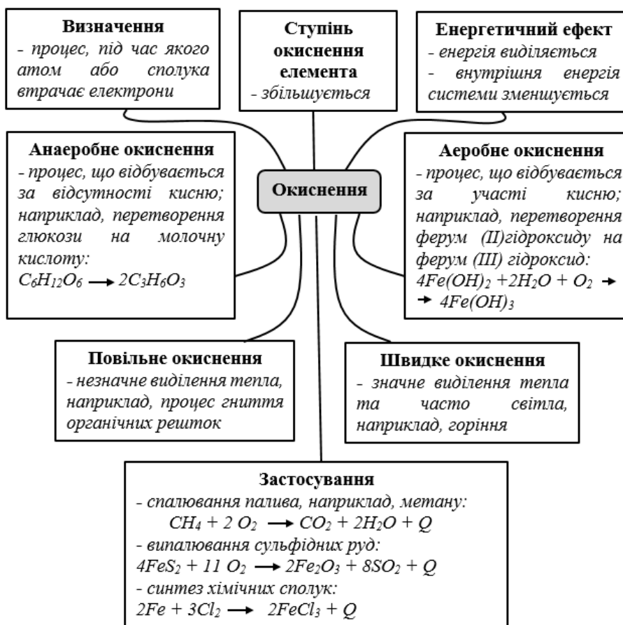
Рис. 2. Стратегія аналізу сутності хімічного процесу

використання ключових понять, відтворення базових знань про себе (рис. 3).