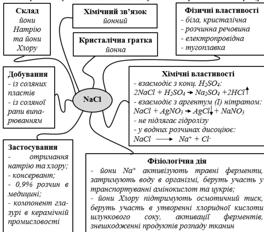
Рис.1. Стратегія аналізу сутності хімічного об'єкта

Саме ментальні карти є потужним засобом формування гностичних умінь учнів, оскільки поєднують найбільш суттєві характеристики хімічного об'єкта, що створює необхідні умови для розвитку відповідної індивідуальної стратегії школяра (рис.1.).