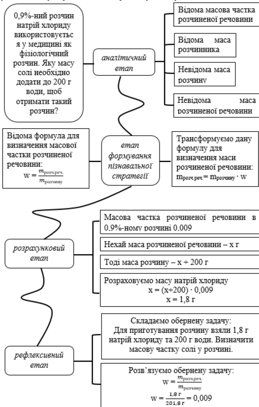
Рис. 4. Стратегія розв'язання розрахункової задачі

Одним із зразків когнітивної стратегії є стратегія розв'язання розрахункових задач. Розв'язування задач є конкретним видом діяльності, що передбачає пізнання процесу перетворення; виділення його структури, конкретних методів і способів діяльності, що й вибудовується у відповідну стратегію, яка презентується у вигляді ментальної карти (рис. 4).