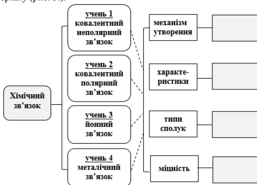
Рис.5. Стратегія узагальнення теоретичних знань

Тому важливою складовою у цілеспрямованому розвитку пізнавальних стратегій учнів вважаємо комунікативну стратегію – усвідомлену лінію комунікативної поведінки у конкретній ситуації спілкування, яка використовується для забезпечення спілкування з іншими учнями та подолання труднощів, викликаних недостатністю знань теоретичного та практичного характеру. Особливо важливою комунікативна стратегія є на етапі узагальнення навчального матеріалу (рис. 5.).