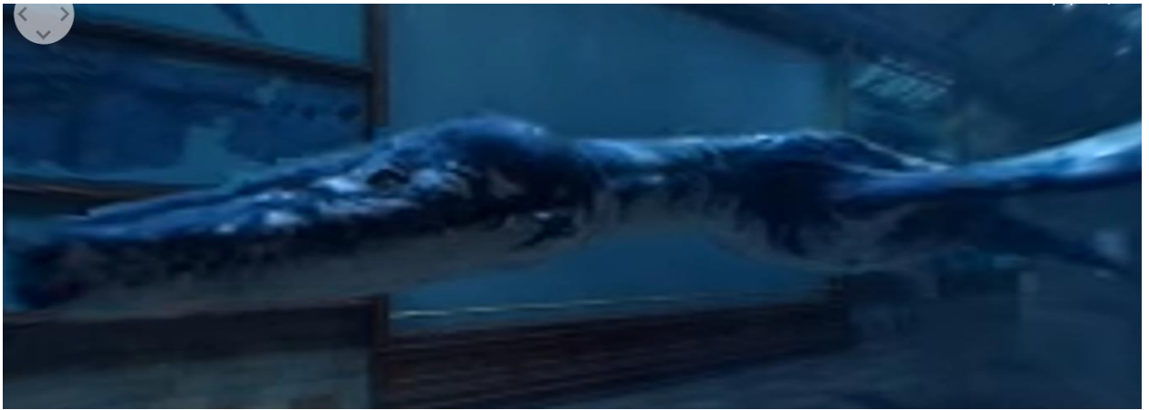
Рис. 1. Морський дракон (фрагмент відео) у лондонському Музеї історії і природознавства

«Ми хотіли дати вам уявлення про те, як насправді виглядали ці колосальні істоти», – написав Аміт Суд, директор Інституту культури Google, у дописі в блозі Google for Education. «Тому ми працювали з екологами, палеонтологами та біологами, щоб накласти віртуальну шкіру та плоть на збережені скелети» [2].