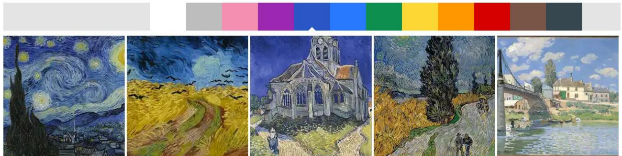
Рис. 3. Підбірка картин за вибором кольору

Для прикладу, на занятті з кольорознавства при вивченні психології кольору, викладач ставить завдання – вивчити вплив кольору на загальний психічний стан людини. Функція вибору колекції картин за кольором зробить це завдання захоплюючим, в один клік фільтр виділить картини з відтінками одного кольору, з порівнянням художників різних епох і стилів (рис. 3).