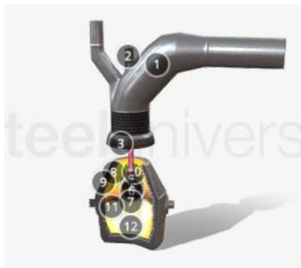
Рис. 4. Модель кисневого конвертера з інтерактивними анотаціями

Образне уявлення реального об'єкта повністю відповідає його віртуальній моделі, а пізнавальна активність студентів під час заняття набирає оберти, а це означає, що 3D-моделі можуть конкурувати у вигляді наочностей з реальними моделями установок.