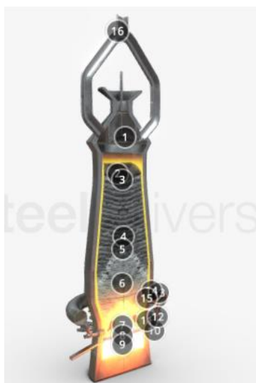
Рис. 3. Модель доменної печі з інтерактивними анотаціями

Під час вивчення тем про виробництво чавуну і сталі студентів зацікавили запропоновані Steeluniversity моделі печей, вони виявляли неабиякий інтерес до можливостей перегляду установки з різних сторін (зверху, знизу, збоку), адже у них з'явилася можливість повертати їх на екрані під різним кутом. Якщо увімкнути анотації, кожна частина печі з її найменшими деталями буде мати свою характеристику, що значно економить час для вивчення даної теми (рис. 2, 3).