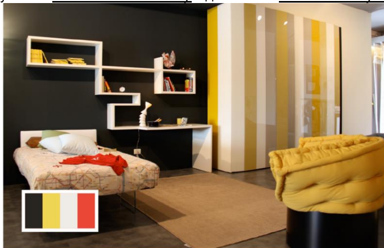
Рис. 5. Дизайнери інтер'єрів використовують колір, щоб оживити приміщення.

Ефективне використання кольору надто важливе для дизайну [4]. Проте у цьому і полягає складність придумування різних поєднань кольорів, адже існує безліч комбінацій. Обираючи кольорову палітру, корисно знати теорію кольорів – логічну структуру та практичне керівництво для змішування кольорів, котре охоплює інформацію – від кольорового кола до значення окремих кольорів. Гарним підґрунтям є Basic Color Theory від Canva та Color Theory 101 від Hubspot.