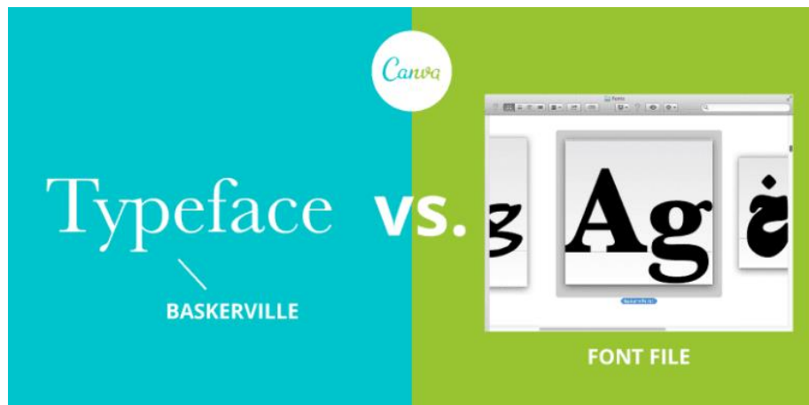
Рис. 1. Співвідношення гарнітури (Typeface) та шрифту (Font) на Canva.com.

Наступним важливим елементом вивчення шрифтів є їхнє правильне поєднання, котре допомагає встановити візуальну ієрархію та покращити читабельність тексту. Почати можна з Typewolf , де вміщений об'ємний ресурс рекомендацій щодо вибору шрифтів та поглиблені інструкції з типографіки. Спеціальна розробка Google Fonts FontPair також має рекомендації щодо поєднання шрифтів. Шрифти можна сортувати за типовими комбінаціями стилів, наприклад, без зарубок та з ними.