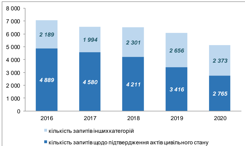
Рис. 2. Співвідношення кількості запитів щодо підтвердження актів цивільного стану до загальної кількості запитів

Традиційно найбільша кількість запитів стосувалася підтвердження фактів народження, шлюбу, розірвання шлюбу та смерті. Якщо проаналізувати статистику і вирахувати співвідношення кількості запитів про підтвердження актів цивільного стану громадян до загальної кількості запитів, що надійшли на адресу архіву, можемо з'ясувати, що відсоток таких запитів за 2016–2020 рр. коливається у межах 55–70 %. Співвідношення кількості запитів щодо підтвердження актів цивільного стану до загальної кількості запитів представлено на Рис. 2.