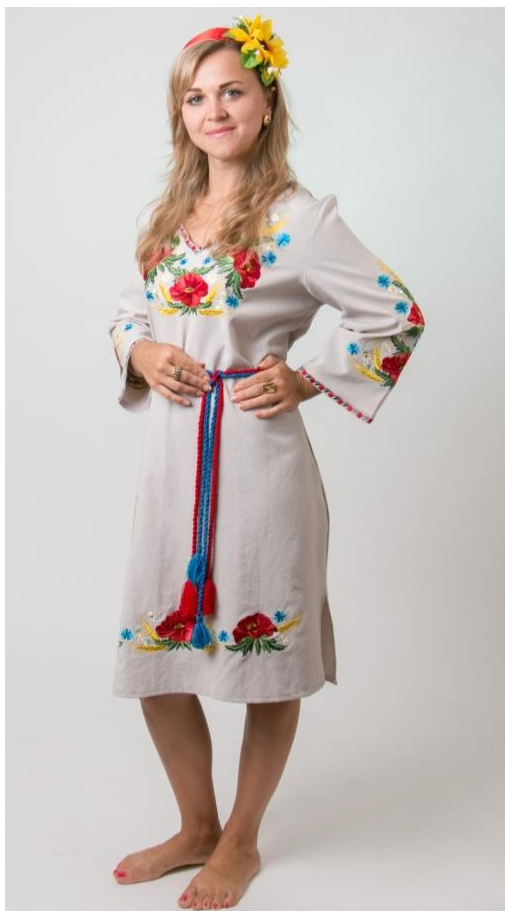
Рис. 5. Сучасна сукня в народному стилі

особливості носіння одягу, крою та його оздоблення. У нашому столітті український костюм переживає черговий підйом популярності. Все більше людей прагнуть одягатися згідно своїх рідних традицій. Для цього не обов'язково надягати класичний костюм минулих століть. Використовуючи знання про український одяг свого регіону, будь-яка людина може збагатити свій одяг рідними автентичними мотивами.