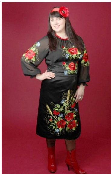
Рис. 3. Сучасний костюм в народному стилі

Народні мотиви та сучасність: невичерпна скарбниця народної творчості та національних традицій завжди надихала дизайнерів, художників та модельєрів на створення повсякденного і святкового одягу за народними мотивами. Особливо актуальна фольклорна тема в індустрії одягу сьогодні: вітчизняні та зарубіжні журнали мод нашій увазі пропонують пальта, куртки, костюми, сукні, блузи, брюки, у крої та оздобленні яких використані елементи народного одягу. Існують і назви цих стилів, як-то: «фолк», «рустів», «кантрі». Вивчаючи народний досвід, художники-модельєри розширюють асортимент сучасного одягу, вносять у нього неповторність та своєрідність народного мистецтва.