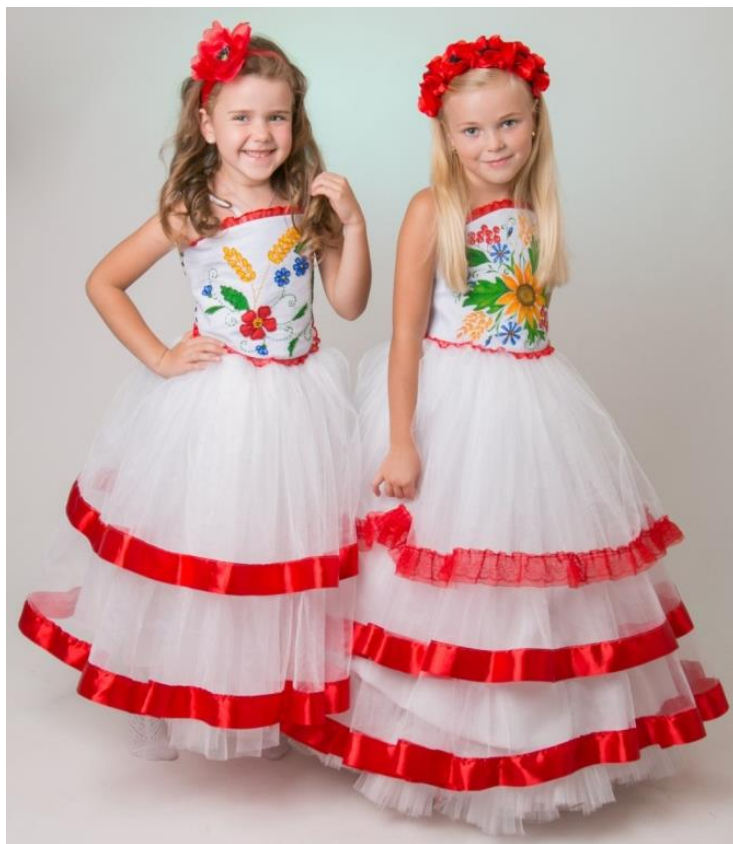
Рис. 6. Варіації на тему національного костюма. Корсет розмальований автором (Ільченко О.)