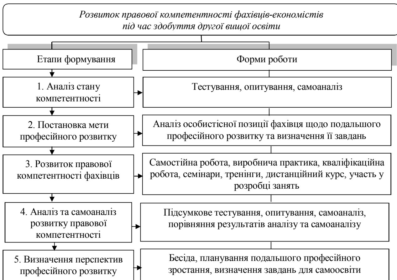
Рис. 1. Розвиток правової компетентності фахівців-економістів під час здобуття другої вищої освіти.

У навчально-виховному процесі здобуття другої вищої освіти потрібно також застосовувати такі принципи активного навчання: активізація розумової діяльності під час усіх видів занять; активний характер навчальної та квазіпрофесійної діяльності під час практичних занять; самостійне розв'язання складних професійних завдань за методом проєктів; постійна суб'єкт-суб'єктна взаємодія викладачів зі студентами; залучення студентів до розробки навчально-методичного забезпечення освітнього процесу та інше. Форми навчально-методичної роботи, які використовувалися з метою розвитку правової компетентності фахівців-економістів, наведені на рисунку 1.