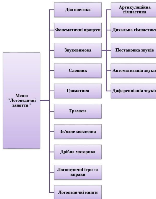
Рис. 2. Схема внутрішньої структури сайту http://logoclub.com.ua .

У додатковому меню «Логопедичні заняття» вміщено статті, консультації, поради, рекомендації, дидактичні ігри та вправи, мовленнєвий матеріал тощо відповідно до завдань та напрямків логопедичної роботи. Схема меню «Логопедичні заняття» подана на рисунку 2.