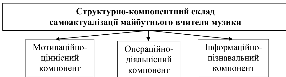
Рис. 1.1. Структурні компоненти самоактуалізації майбутнього вчителя музики

Враховуючи викладене і на підставі проведеного психолого-педагогічного аналізу самоактуалізації особистості, ми вважаємо, що до структурно-компонентного складу самоактуалізації майбутнього вчителя музики мають входити такі компоненти (рис. 1.1.)