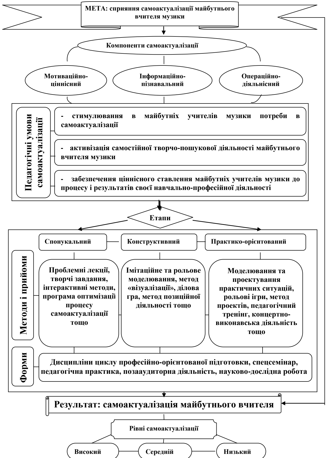
Рис.3.2. Модель сприяння самоактуалізації майбутніх учителів музики в процесі професійної підготовки