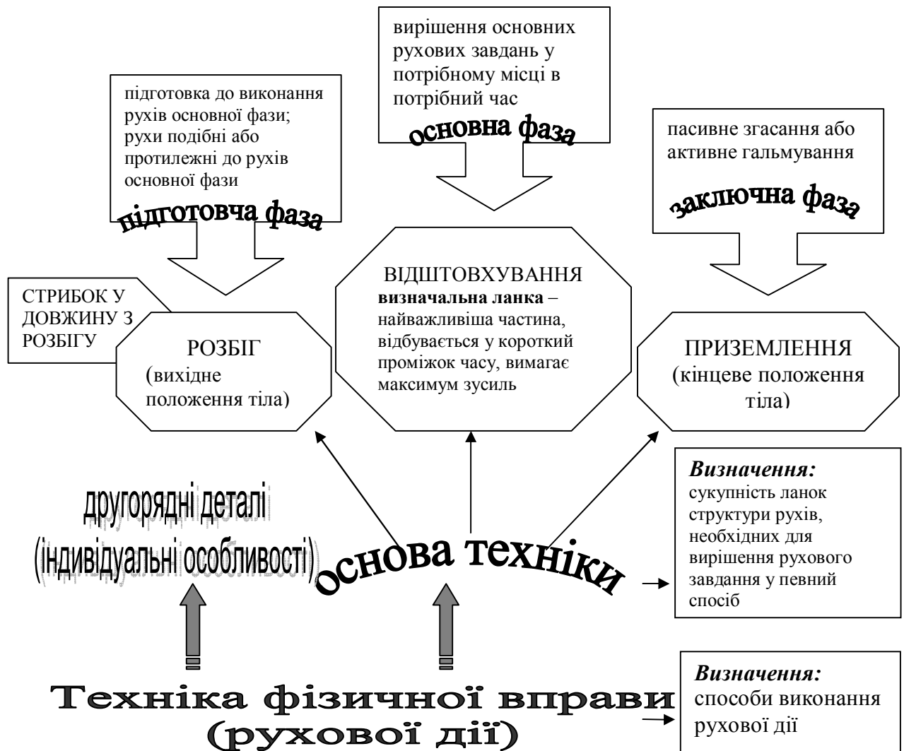
Рис 3. Опорний конспект №2 до теми “Засоби фізичного виховання дітей дошкільного віку”

➤ Проведення диспутів . Можлива тематика диспутів: “Проблема наступності у фізичному вихованні дітей дошкільного віку та молодших школярів: реалії та перспективи розвитку”; “Індивідуалізація та фронтальна організація діяльності дитини”; “Традиції та інновації у фізичному вихованні дошкільнят”; “Повзання – основний спосіб пересування дітей першого року життя”; “Вплив виконання метання різними способами на зміцнення м’язів плечового поясу” та ін.