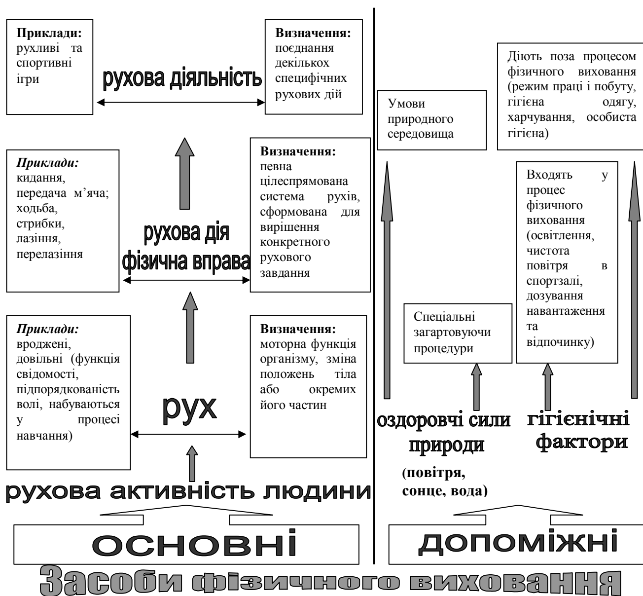
Рис 2. Опорний конспект №1 до теми “Засоби фізичного виховання дітей дошкільного віку”