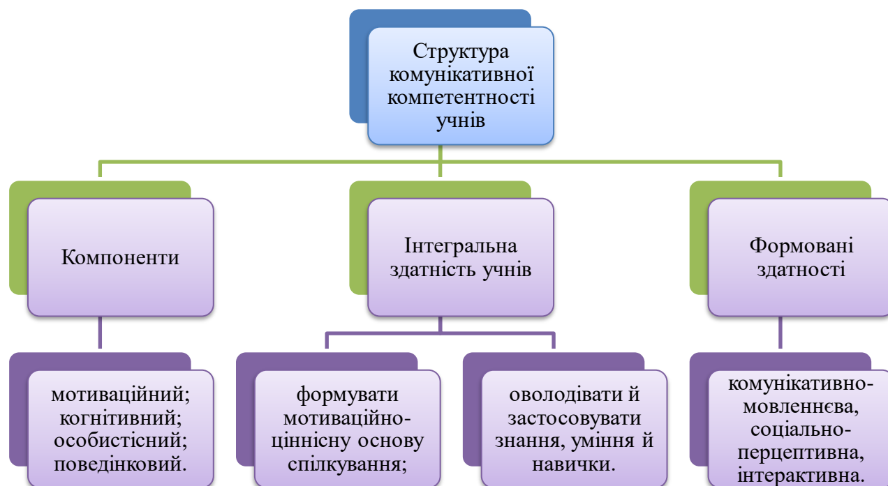
Рис. 2.2.1. Структура комунікативної компетентності учнів

впевненість особистості у правильності її дій. Неможливо здійснювати діяльність без знань. У груповій роботі знання можна передати двома способами – через вербальне і невербальне спілкування.