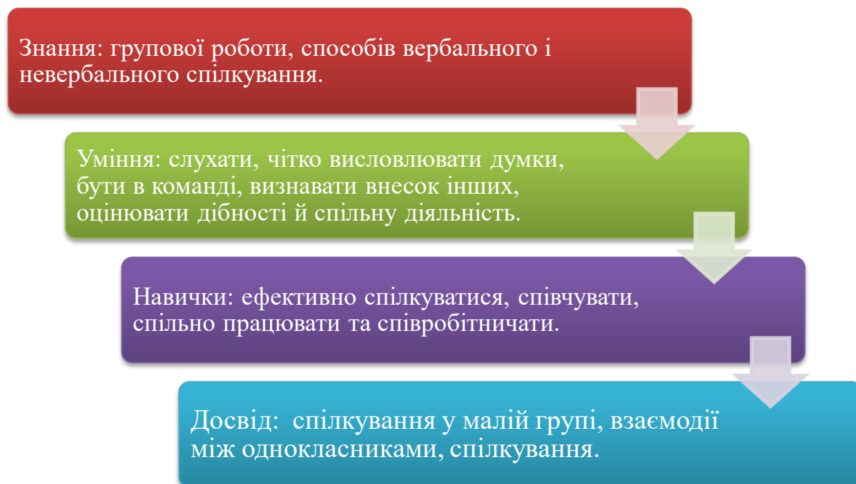
Рис. 2.2.2. Складові комунікативної компетентності молодших школярів.

Остання складова, яка також важлива в комунікативній компетентності молодшого школяра – досвід. Це відображення в свідомості людини законів об'єктивного світу та соціальної практики, і він отримується завдяки активним практичним знанням. Прикладом досвіду в комунікативній компетентності є спілкування у малій групі, взаємодії між однокласниками, спілкування взагалі (рис. 2.2.2.).