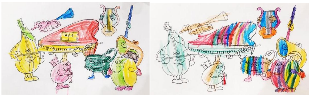
Рис.1. Творчі роботи Романа Т, Артема В.

Ми запропонували маленьким респондентам розмалювати музичні інструменти та назвати їх (рисунок 1).