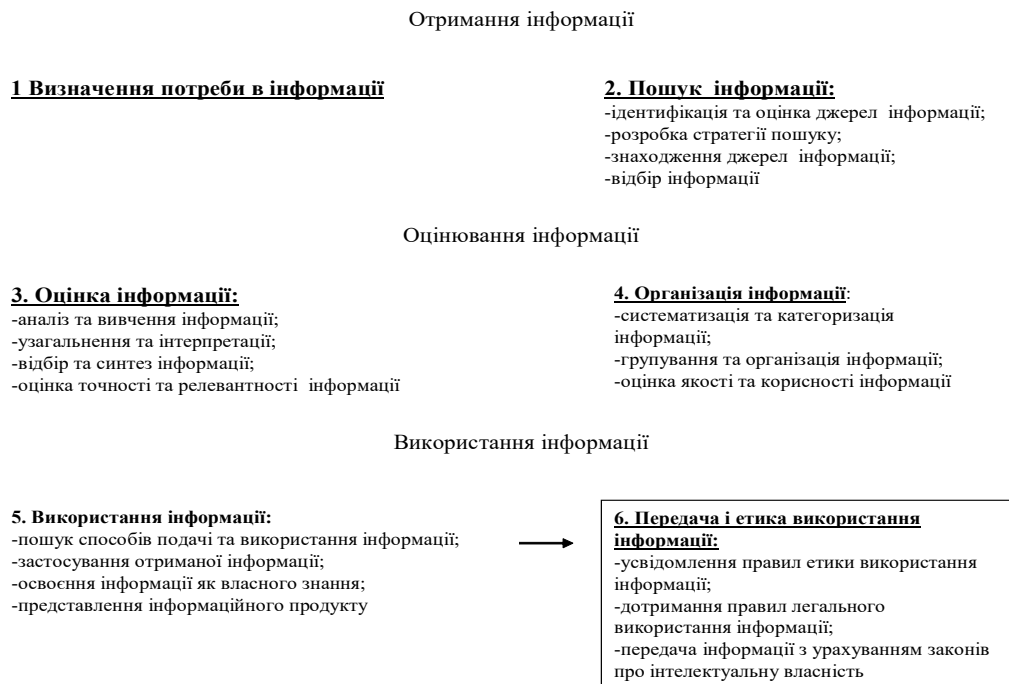
Рис. 2. Компоненти інформаційної компетентності вчителя іноземних мов за видами обробки інформації у процесі професійної діяльності