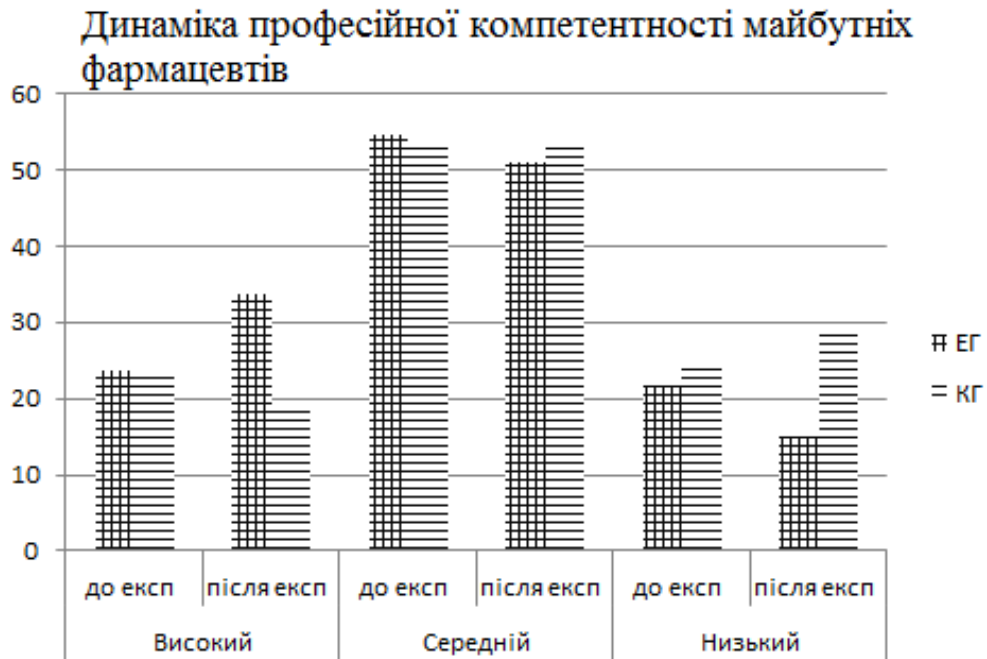
Рис. 2. Динаміка професійної компетентності майбутніх фармацевтів.

Узагальнені результати перевірки за трьома критеріями та визначення їх динаміки у контрольних та експериментальних групах дали змогу зробити висновок про ефективність моделі формування інформаційно-культурологічної компетентності майбутніх фармацевтів. Вимірювання показників засвідчило позитивні зміни в експериментальних групах.