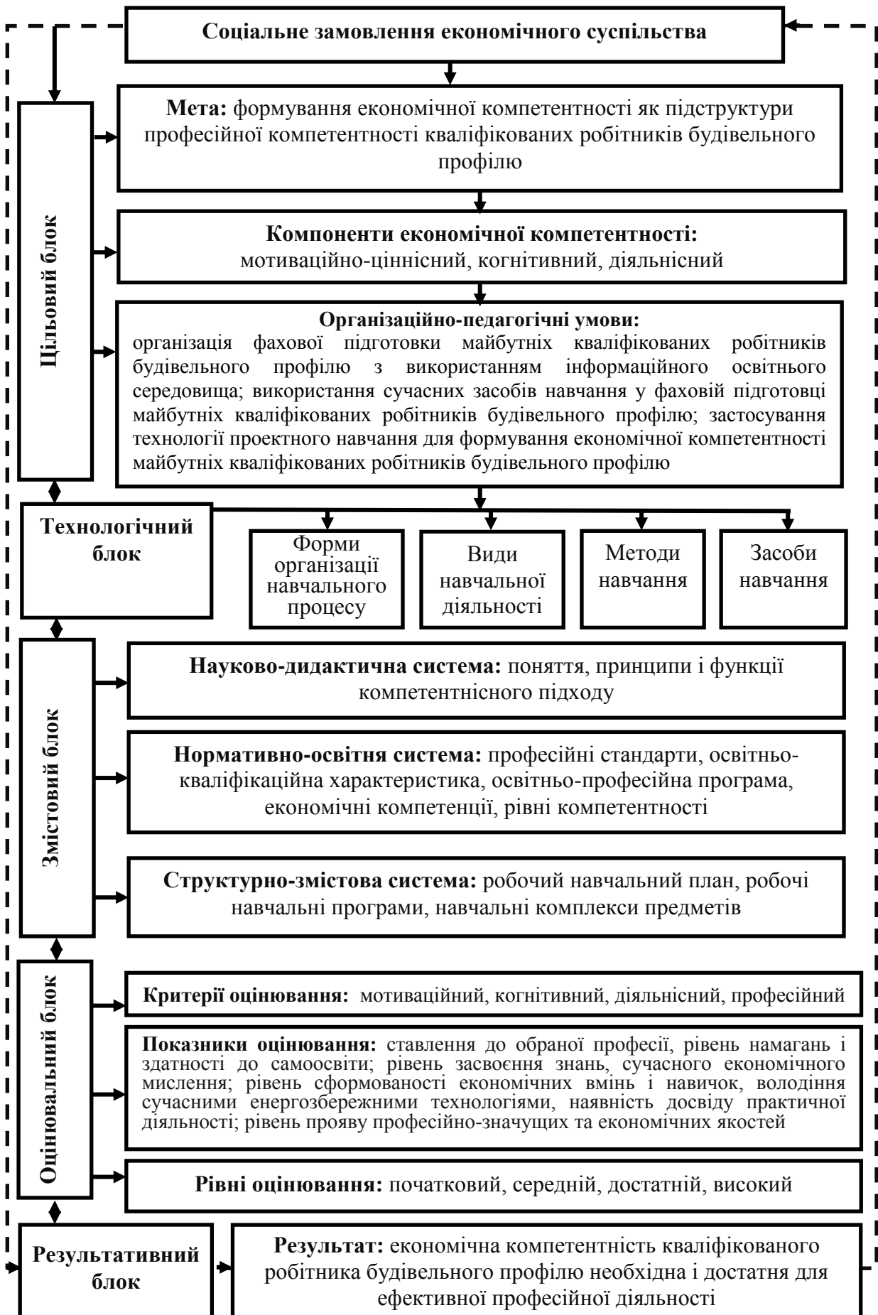
Рис. 1. Модель формування економічної компетентності майбутніх кваліфікованих робітників будівельного профілю у фаховій підготовці