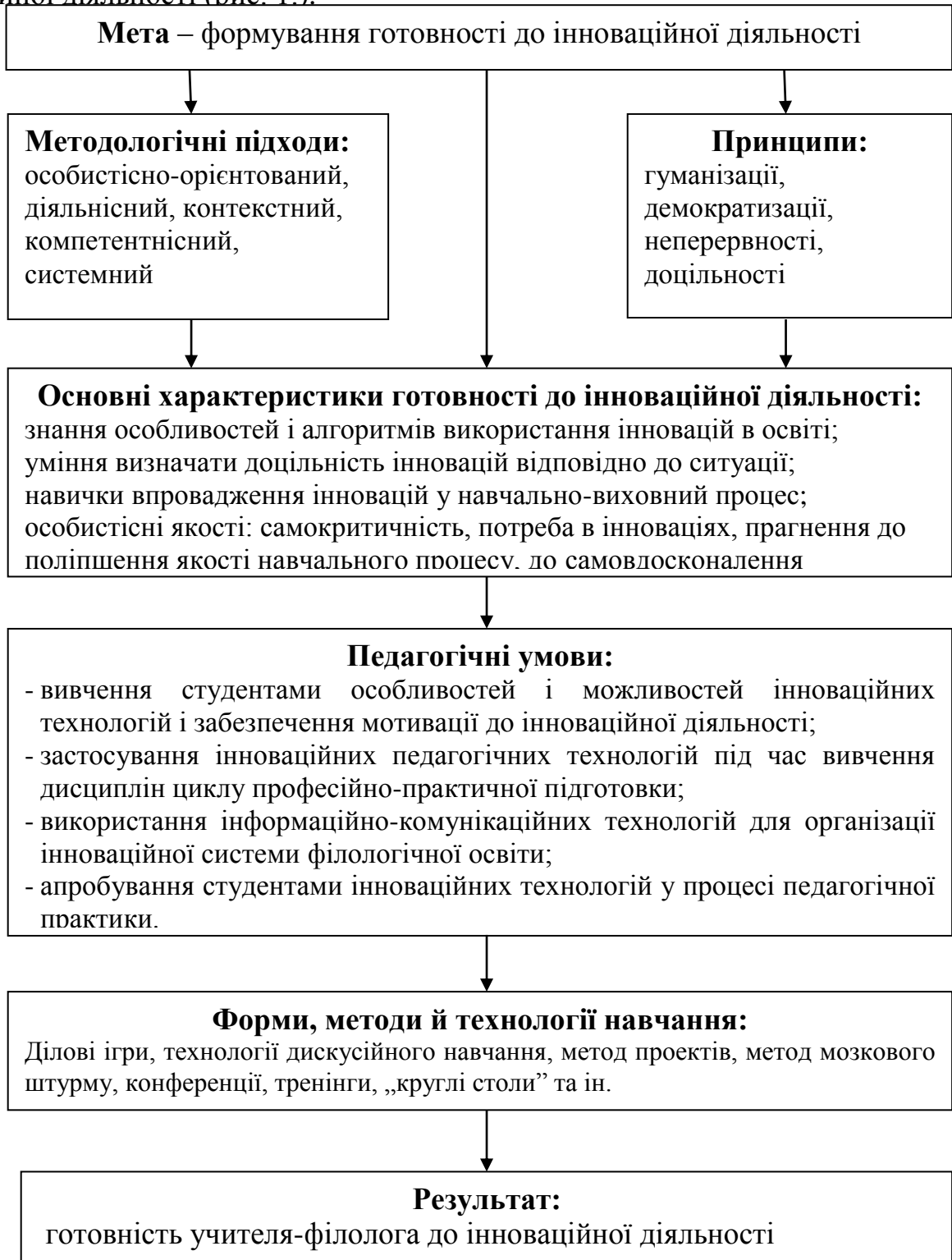
Рис. 1. Модель підготовки майбутніх учителів-філологів до інноваційної діяльності

Метою підготовки майбутніх учителів філологічних дисциплін є засвоєння специфіки різних інноваційних технологій навчання під час вивчення різних дисциплін, апробація цих технологій та ІКТ під час навчання у ВНЗ, а також під час проходження педагогічної практики. Враховуючи все, що зазначене вище, ми пропонуємо модель підготовки майбутніх учителів філологічних дисциплін до інноваційної діяльності (рис. 1.).