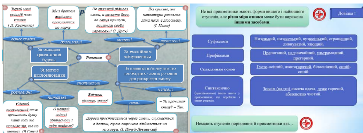
Рис. 3. Зразки карт знань

Карти знань, що використовуються у підручнику, представляють навчальний матеріал у блок-схемному вигляді, що як відомо, сприяє кращому запам'ятовуванню вивченого, спираючись на зорову пам'ять учнів, розширює та поглиблює знання з української мови.