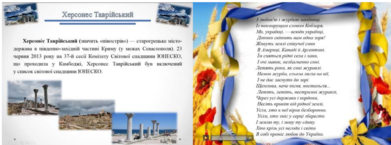
Рис. 2. Зразки додаткових матеріалів та озвучених текстів

Аудіоматеріали можна ефективно використовувати як під час виконання завдань у зошиті, так і в якості аудіозавдань.