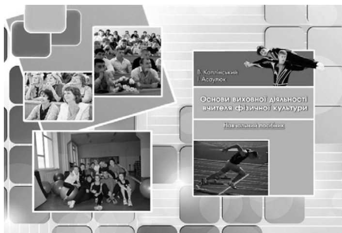
Рис.1. Обкладинка навчального посібника «Основи виховної діяльності вчителя фізичної культури»

Сформованими в процесі багаторічного досвіду роботи у вищій школі, зокрема на факультеті фізичного виховання і спорту інноваційно-творчими знахідками та виховними секретами ми ділимося з майбутніми фахівцями у навчальному посібнику «Основи виховної діяльності вчителя фізичної культури» (див. рис.1).