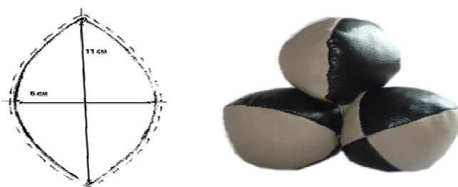
Рис. 3. Шаблон та м'ячі для занять з ботмерівської гімнастики.

Також у ботмерівській гімнастиці використовують різні предмети (м'ячі, палиці, скакалки тощо) [4, с. 4]. Так, для виготовлення саморобних м'ячів необхідно взяти чотири шаблони у формі пелюстки (рис. 3) та зшити, залишаючи збоку між двома «пелюстками» отвір для наповнення. З метою очищення м'ячиків від пилу та бруду при їх виготовленні доцільно використовувати шкіру або заміник шкіри. Потім щільно наповнити попередньо обжареною крупою (найкраще брати просо, за його відсутності – гречку або горох). Розміри м'ячів відрізняються залежно від віку дітей. Для дорослого – 6 см на 11 см, вага – 130 гр.