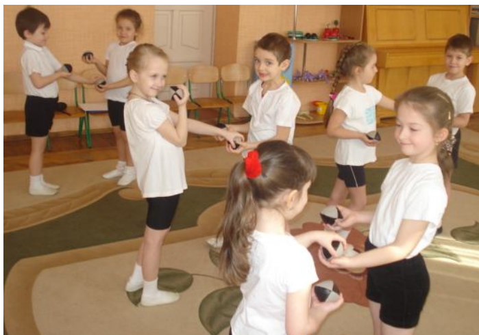
Рис. 5. Виконання вправ з трьома ботмерівськими м'ячами дітьми старшого дошкільного віку ДНЗ№30 «Світлячок» м.Вінниця.