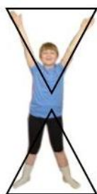
Рис. 1. Фрагмент ботмерівської вправи «Трикутник».

1. Рух – це перехід від точки спокою до якого-небудь напрямку простору; від одного напрямку до іншого; від однієї фігури, розгорнутої в просторових вимірах, до іншої. Рухи у фізичних вправах завжди плавні, сповнені глибинної символіки, часто відображають геометрію навколишнього. Наприклад, при виконанні вправи «Трикутник» утворюється відповідна геометрична фігура (рис. 1).