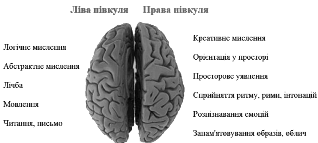
Рис.1. Функції півкуль мозку людини

Для того щоб творчо осмислити будь-яку проблему, недостатньо лише задіяти обидві півкулі, необхідні їхня взаємодія й синхронізація між ними.