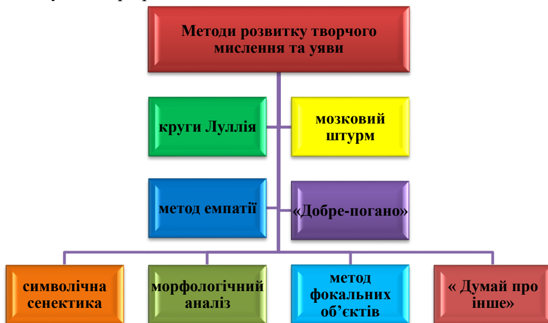
Рис. 1. Методи розвитку творчого мислення та уяви

Здійснювати компетентнісний підхід до навчання, що є головною ціллю навчання в загальному, вчителю допомагають методи розвитку творчого мислення та уяви теорії розв'язання винахідницьких задач.