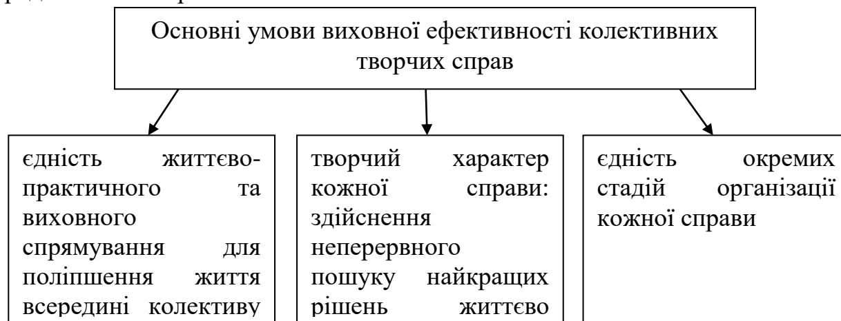
Рис. 1. Основні умови виховної ефективності колективних творчих справ

Основні умови виховної ефективності колективних творчих справ представлено на рис. 1.