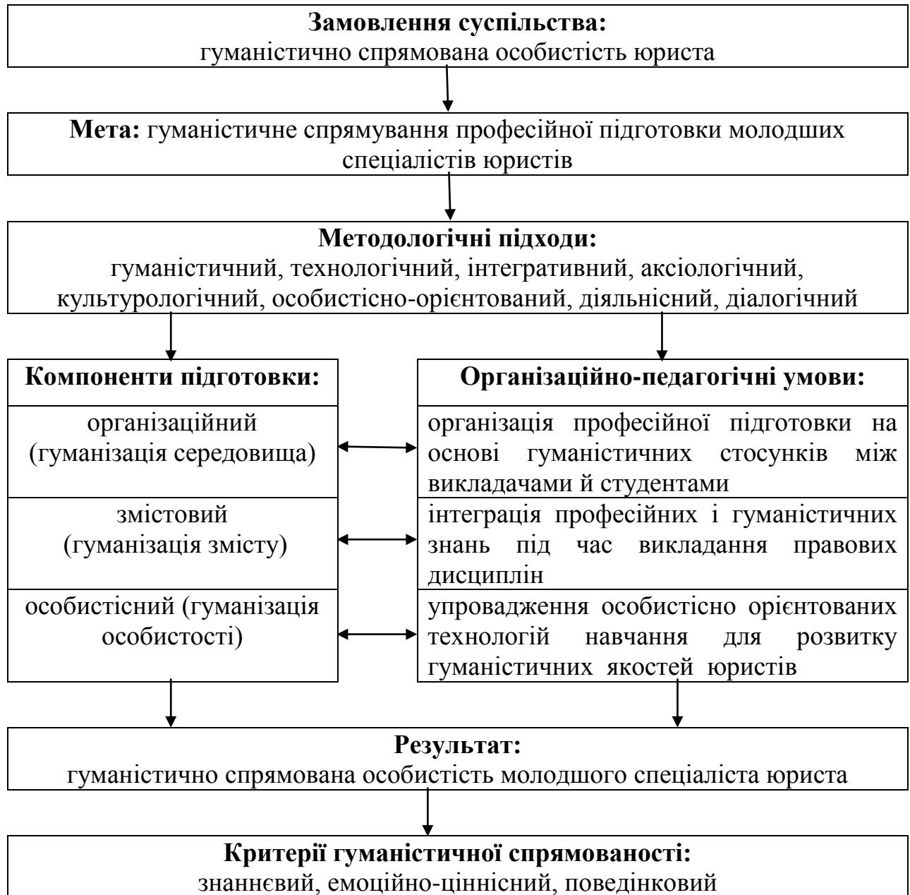
Рис. 2.1. Модель гуманістично спрямованої професійної підготовки майбутніх молодших спеціалістів юристів

Отже, в основу побудови моделі підготовки майбутніх молодших спеціалістів юристів були включені організаційний, змістовий і особистісний компоненти (рис.2.1).