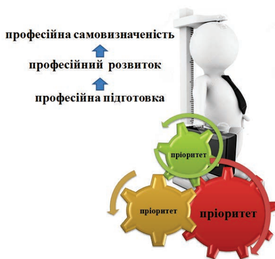
Рис. 2. Роль пріоритетів у процесі становлення випускника педагогічного закладу вищої освіти.

Процес формування високо компетентного майбутнього педагога досить складний та багатогранний, він передбачає професійну підготовку, яка стимулює професійний розвиток студентів та веде до їх професійного самовизначення. Проте, на нашу думку, цей процес приводять в рух саме пріоритети професійного становлення самого педагога (Рис. 2.).