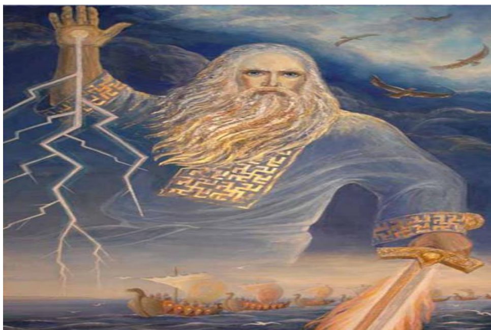
Перун – бог грому і блискавки, бог війни і миру, їздив у хмарах колісницею