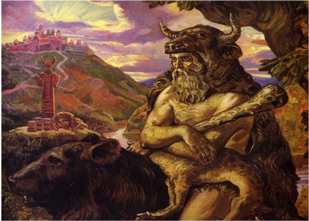
Волос (Велес) – покровитель скотарства та поезії