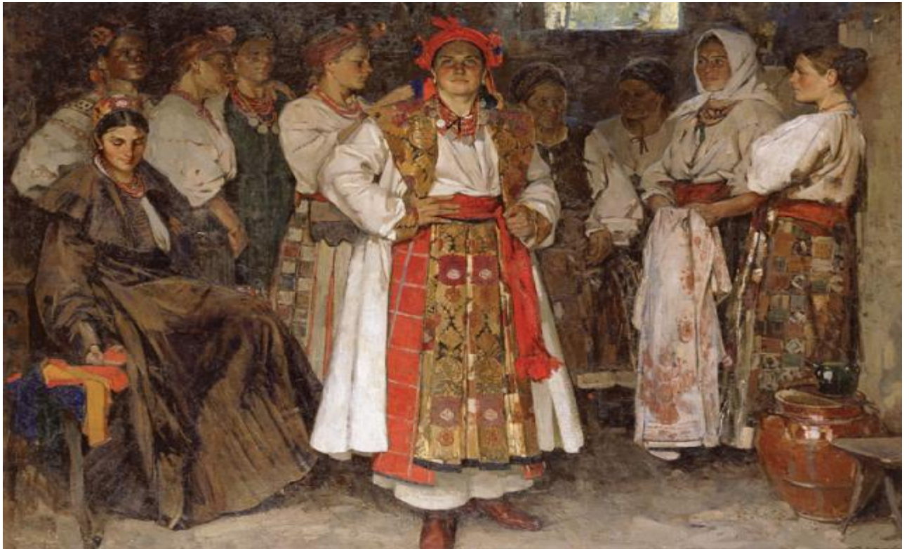
Федір Кричевський. Наречена. 1910