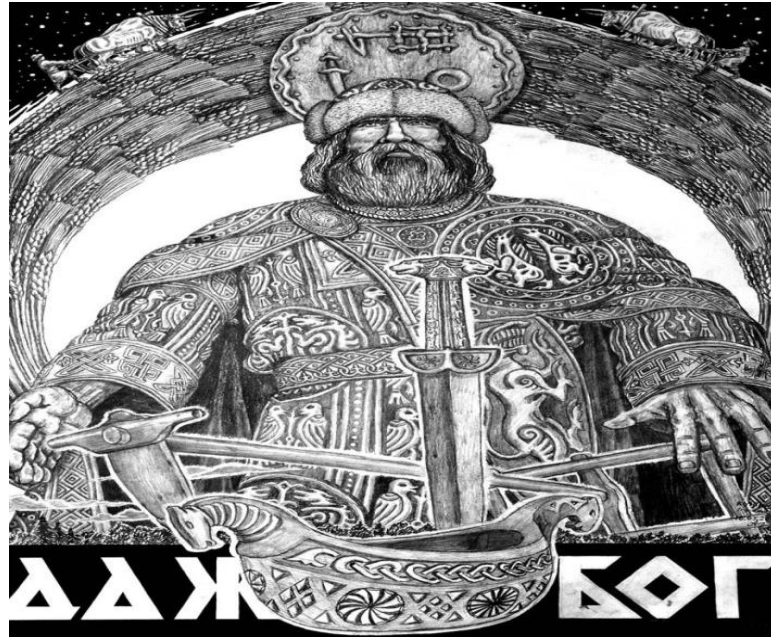
Дажбог – бог сонця, покровитель Руської землі