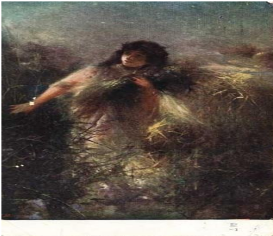
Ярослав Пестрак. Русалка