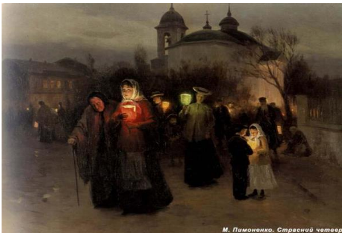
Микола Пимоненко. Страсний четвер