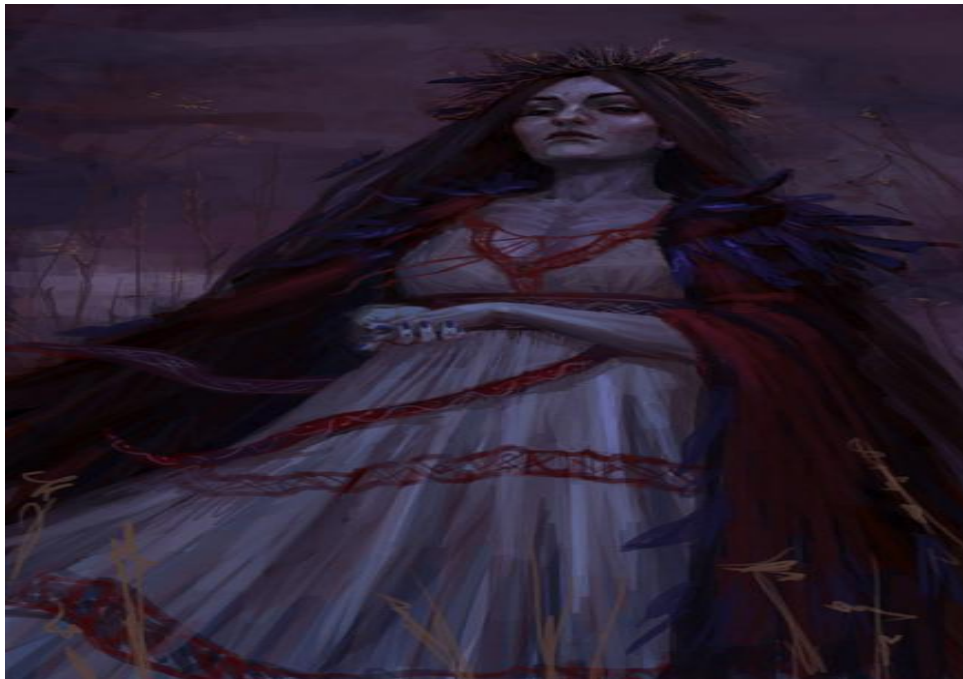
Мара (Марена) – донька Чорнобога, богиня темної ночі, страшних сновидінь, привидів, хвороб, смерті