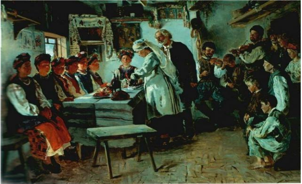
Володимир Маковський. Дівич-вечір. 1883