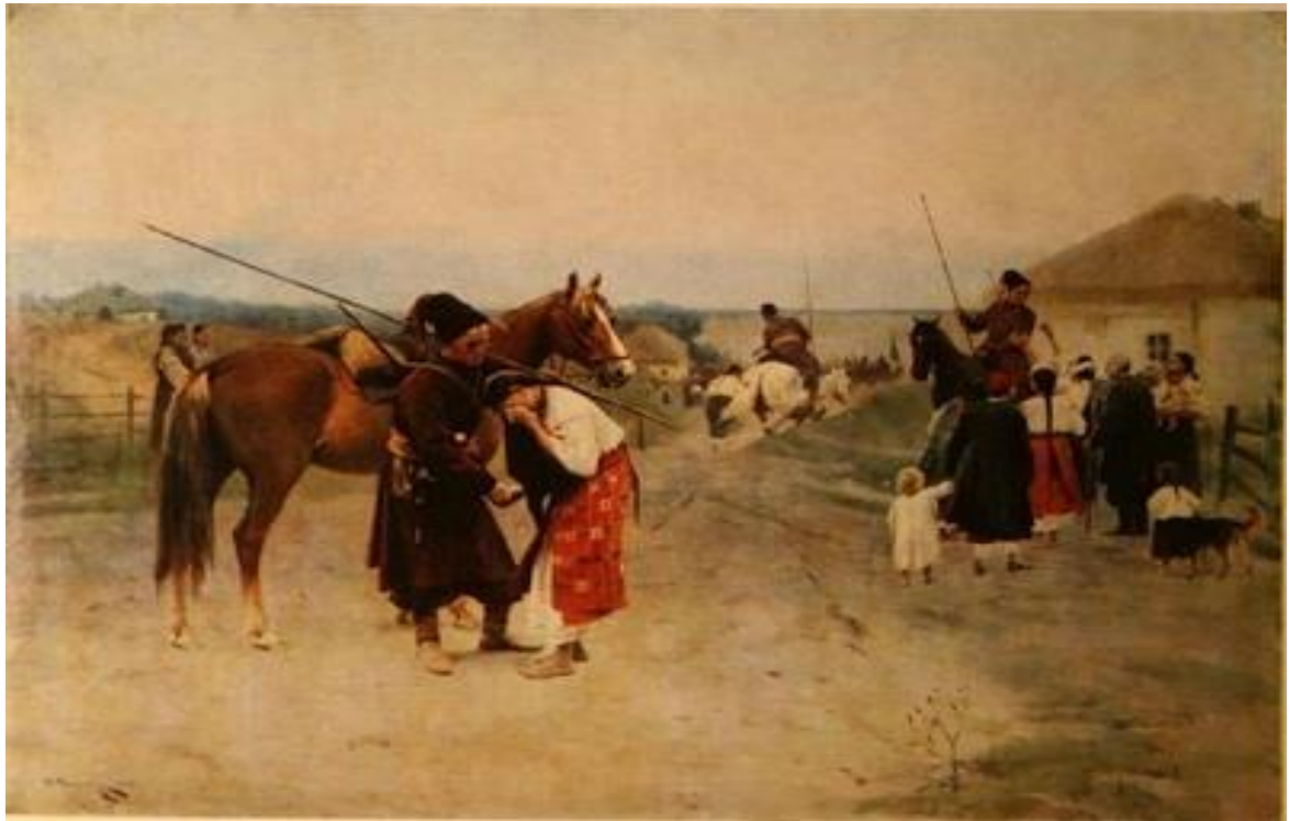
Микола Пимоненко. У похід