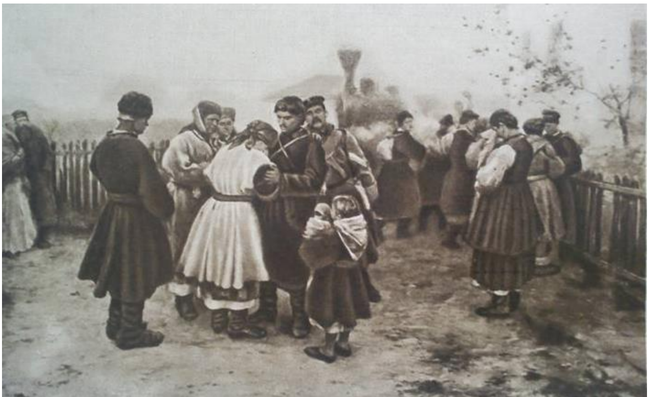
Микола Пимоненко. Проводи рекрута