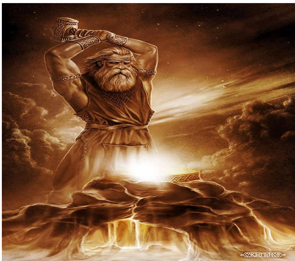
Сварог – бог-коваль, навчив людей хліборобства, подарував їм плуг