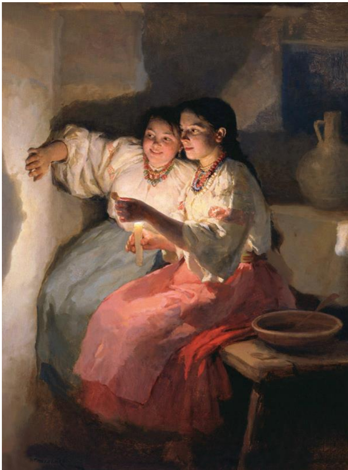
Микола Пимоненко. Святочне ворожіння