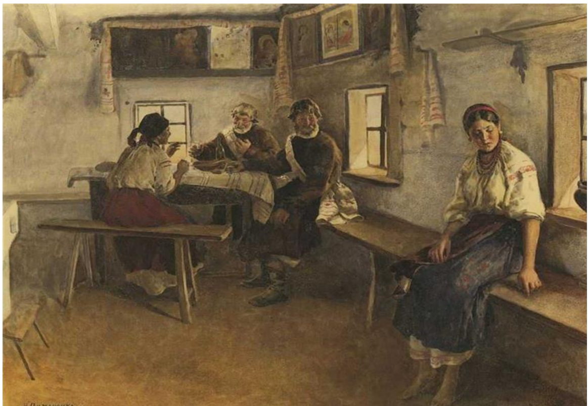
Микола Пимоненко. Засватали