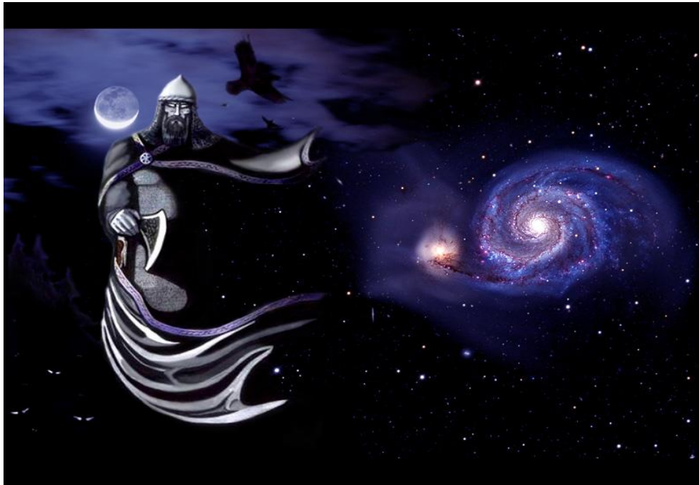
Чорнобог – бог темряви, ночі, зими, холоду, сну