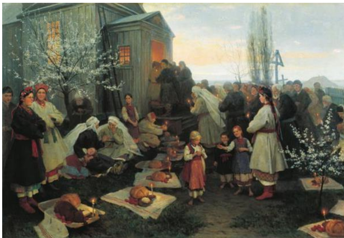
Микола Пимоненко. Великдень у Малоросії