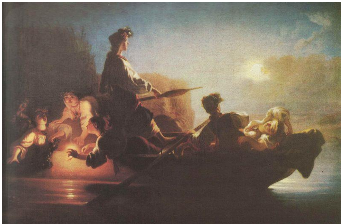
Іван Соколов. Ворожіння на вінках