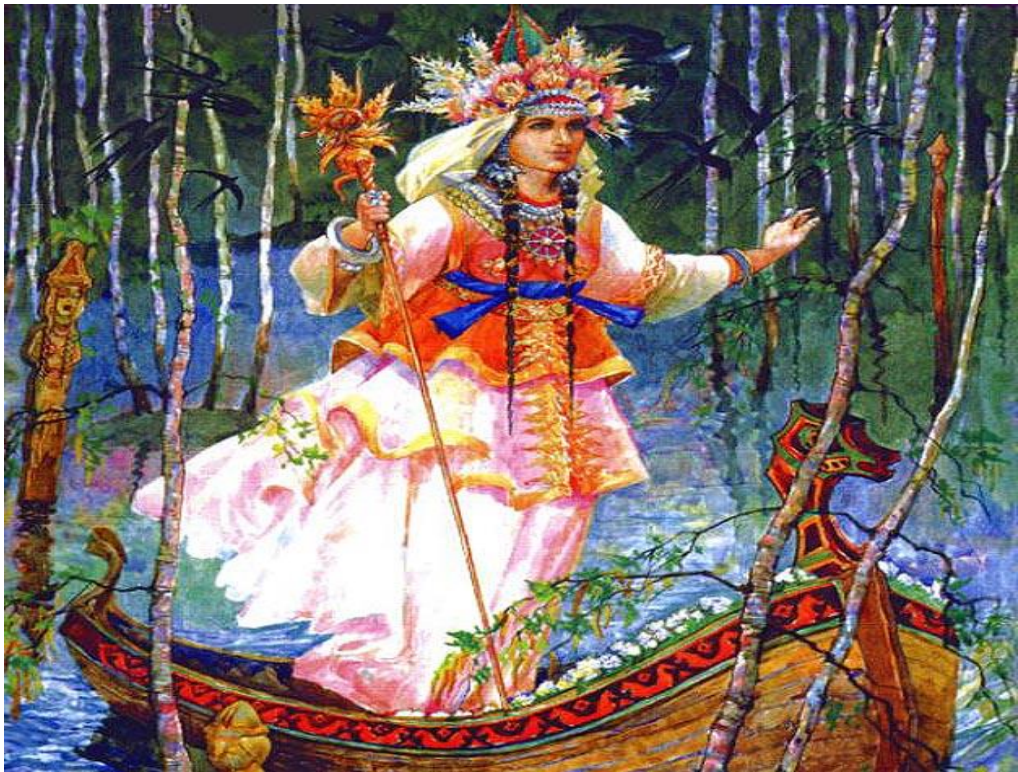
Берегиня – богиня добра й захисту від усілякого лиха