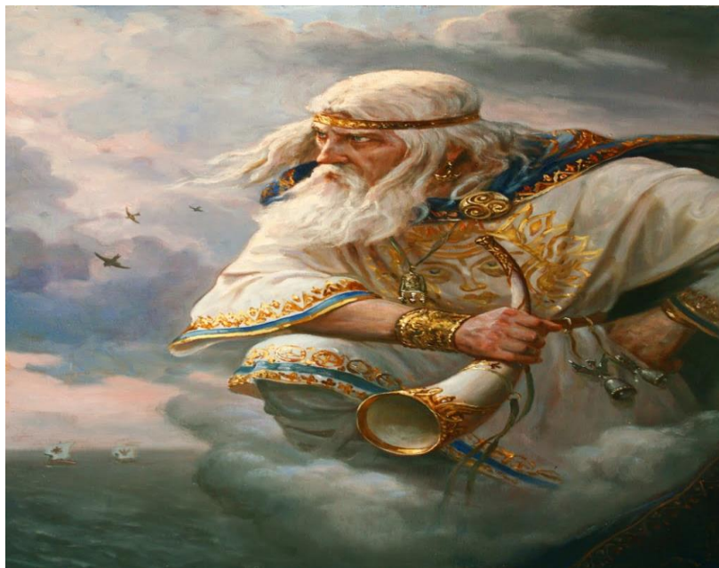
Стрибог – бог вітру