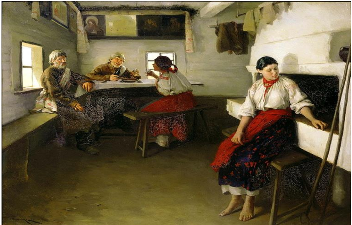
Микола Пимоненко. Свати