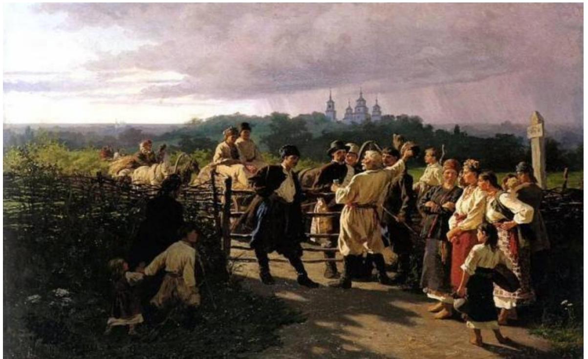
Костянтин Трутовський. Весільний викуп. 1881