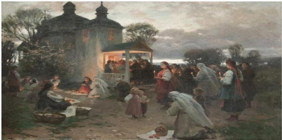
Н.Пимоненко «Пасхальна заутрення» Почало ХХ в.