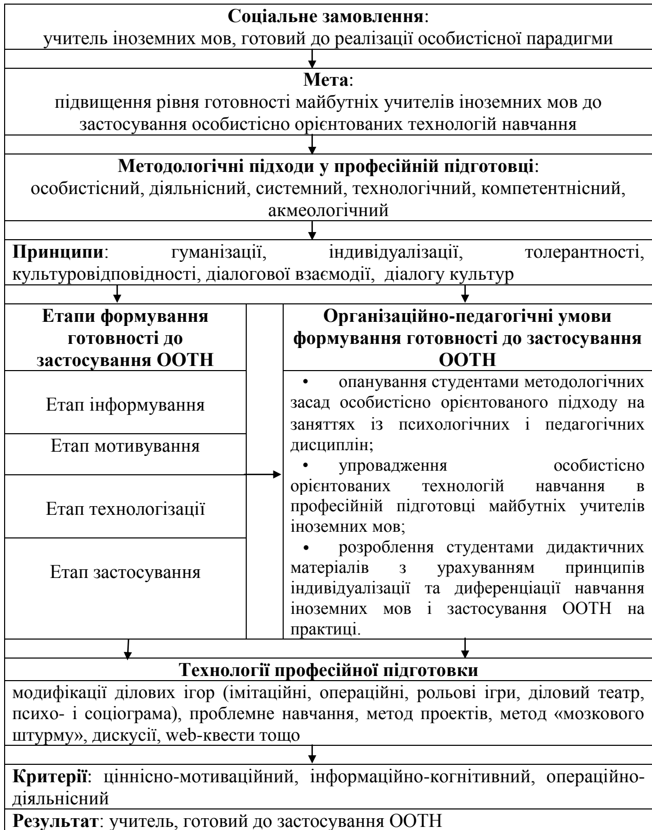
Рис.2.1. Модель формування готовності майбутніх учителів іноземних мов до впровадження ООТН

цілісний і динамічний процес, у якому мають бути враховані потреби суспільства й особистості (рис.1).