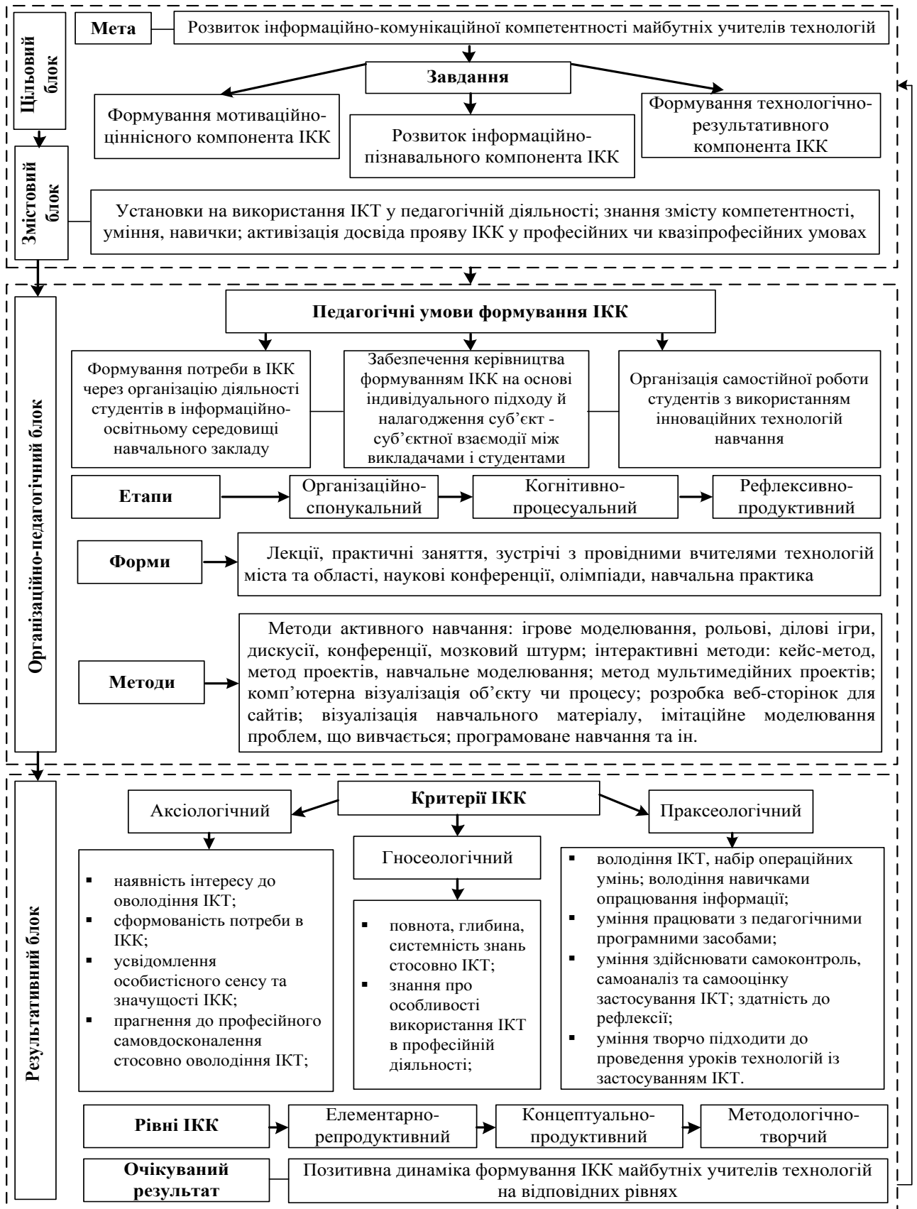
Рис. 1. Модель формування ІКК майбутніх учителів технологій