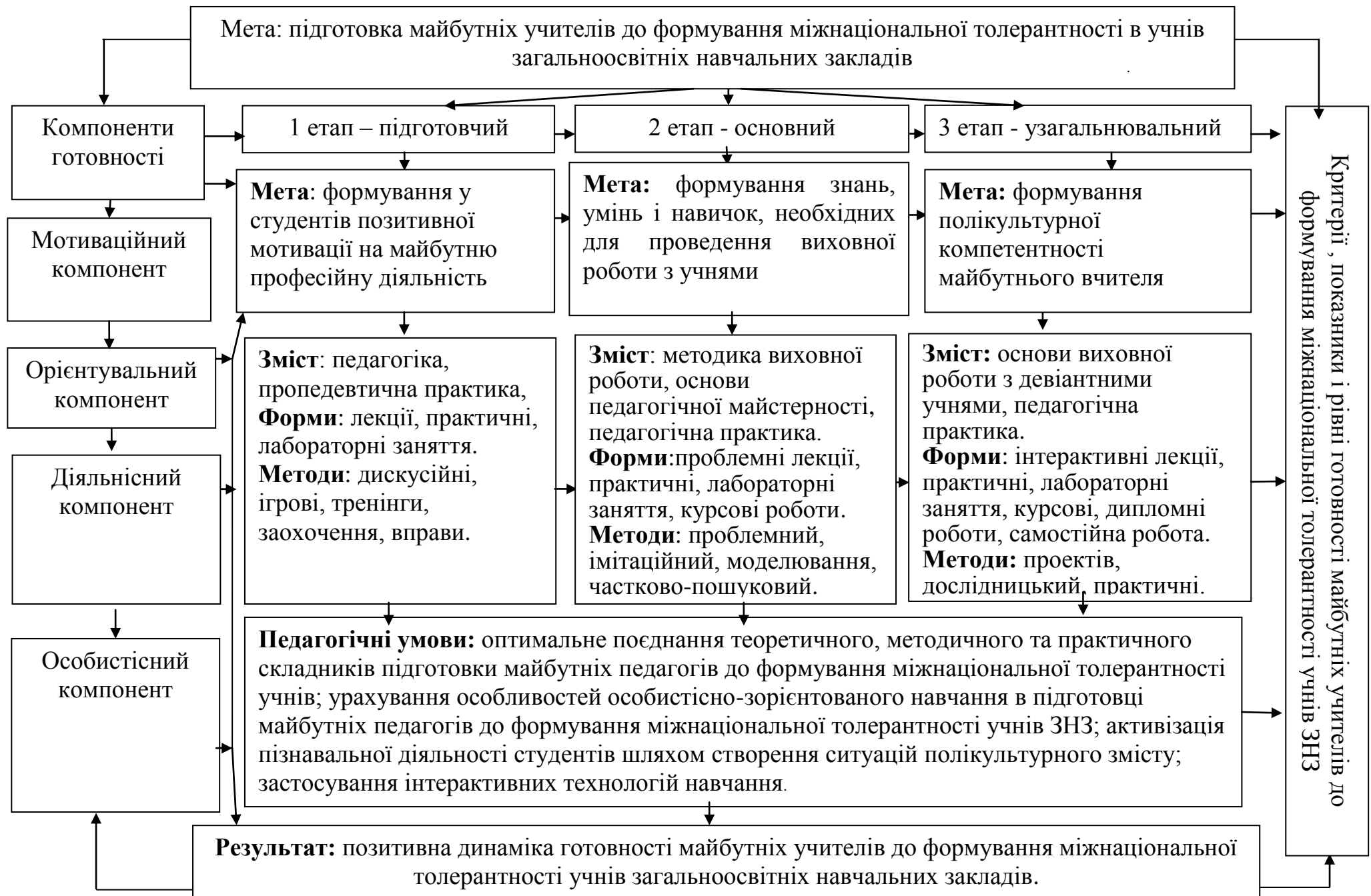
Рис. 1. Модель підготовки майбутніх учителів до формування міжнаціональної толерантності учнів