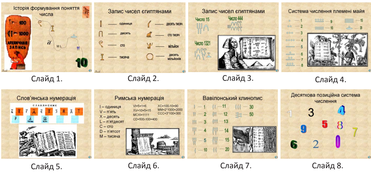
Слайд 1. Слайд 2. Слайд 3. Слайд 4.