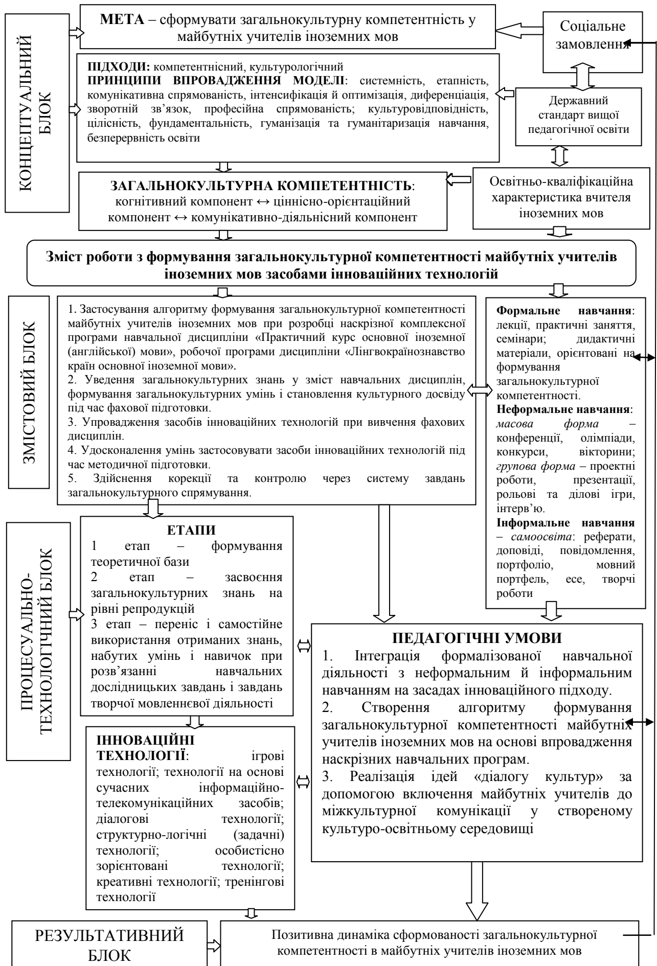
Рис. 2. Модель формування загальнокультурної компетентності майбутніх учителів іноземних мов засобами інноваційних технологій