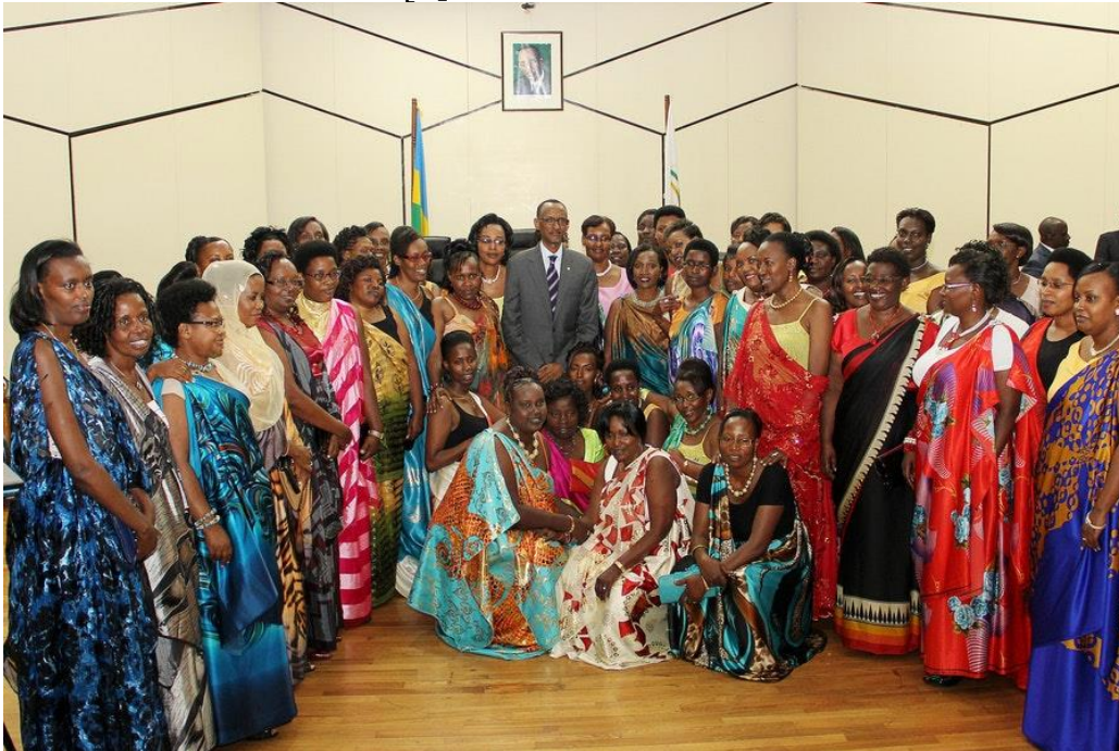
Жінки – члени парламенту з президентом Руанди Полем Кагаме.

Проте в Південній Америці і в Африці зафіксовано найвищі показники статевої рівності. Наприклад, в Африці, рекордно велика частка жінок, 58%, у Руанді, Демократичній Республіці Конго (8%), Нігерії (6%). Подібна ситуація помітна в Південній Америці: жінки в Болівії отримали 52% місць у парламенті, тоді як у Бразилії – всього лише 11%. [5].