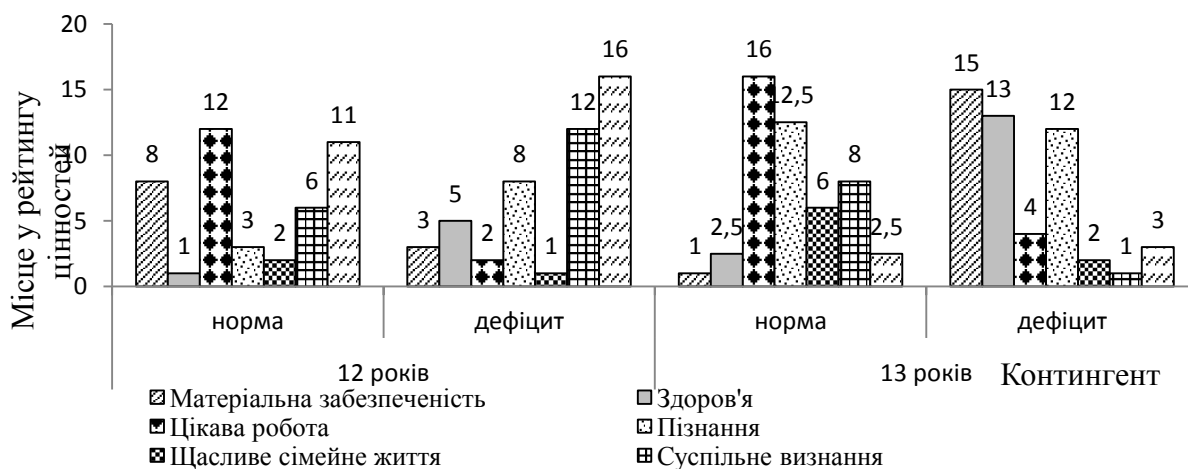
Рис. 1. Динаміка термінальних цінностей дівчат 12 – 13 років (n = 138)

Вивчаючи динаміку термінальних цінностей дівчат 12-13 років ми помітили, що матеріальні цінності у респонденток із нормальною масою тіла посилилися на 7 пунктів (із 8 до 3 місця в ієрархії цінностей), а у дівчат із дефіцитом маси тіла, навпаки, їхня цінність знизилась з 1 до 15 місця (рис. 1).