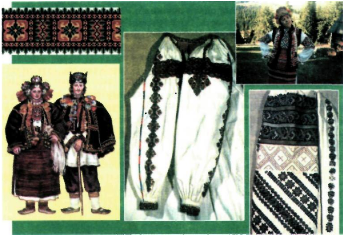
Рис. 6. Вишивки Карпатського регіону

Вишивки виконують нитками різного кольору: червоного, помаранчевого, зеленого, жовтого і чорного. Така колористична різноманітність у вишивці поєднується гармонійно. Типовою є вишивка вовняними нитками згущеними стібками: окремі елементи обводять кольоровими нитками, що забезпечує високий рельєф та кольоровий ефект. Такі вишивки розміщують уздовж усього полотна повздовжніми або скісними смугами.