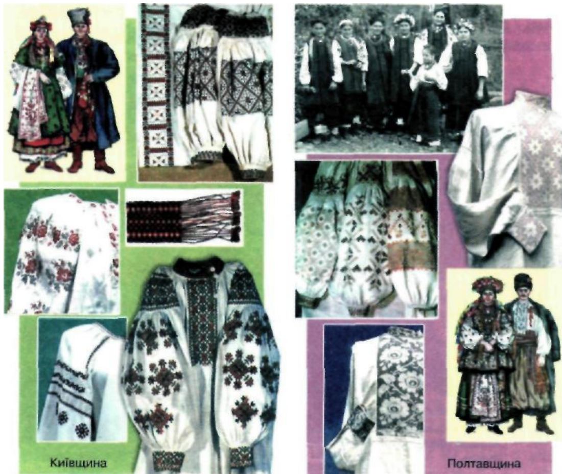
Рис. 2. Костюм Наддніпрянщини

Для Київщини типові техніки «набирування», «хрестик», характерна двоколірна червоно-чорна вишивка іноді з додаванням третього кольору – жовтого або зеленого.