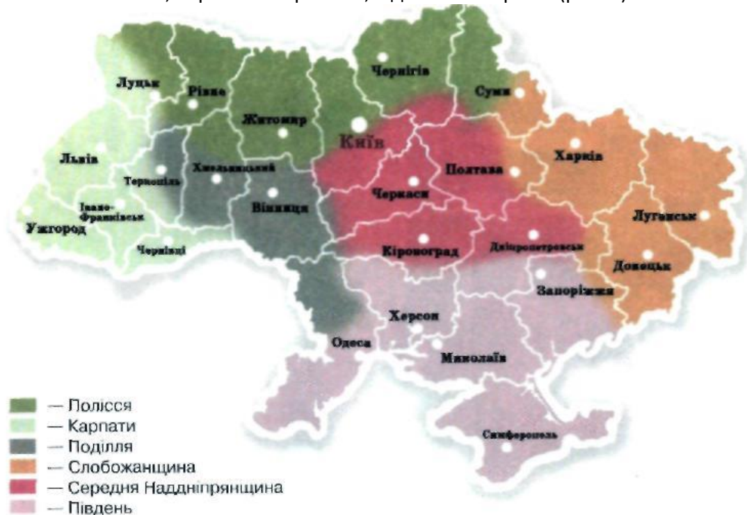
Рис. 1. Етнографічні регіони України

До Середньої Наддніпрянщини належать райони, розташовані по середній течії Дніпра. Цей регіон є центром давньоруської народності, її культурного життя. Вишивкам цього регіону властиві пишні вишукані рослинно-геометризовані орнаментальні мотиви з квітками, листям, бутонами. Вироби оздоблюють гладдю, занизуванням, набируванням та хрестиком. Основні кольори вишивок – білий, коралово-червоний, відтінений чорним (рис. 2).