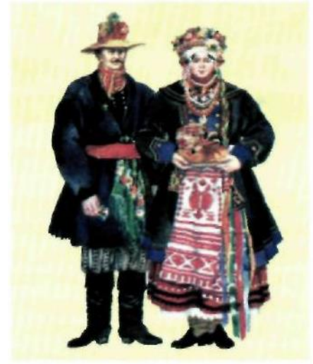
Рис. 5. Костюм Слобожанщини

Колорит оздоблення яскравий, із переважанням червоного кольору. Орнаменти здебільшого вишивають грубою ниткою, завдяки чому узори справляють враження рельєфних. Рукави жіночих сорочок прикрашають орнаментальними мотивами, розміщеними в шаховому порядку, а також з акцентом декору на вузькій частині рукава.