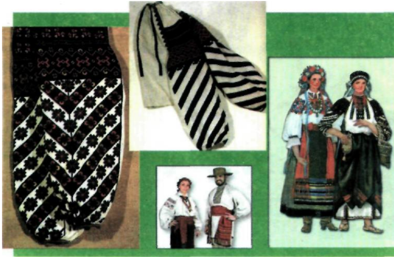
Рис. 4. Костюм Поділля

Слобожанщина охоплює східну частину України. Техніка вишивання цього регіону має багато спільного з усталеними формами вишивки центральних областей України, але їй властиві й цілком своєрідні поліхромні (багатокольорові) орнаменти, що виконуються технікою дрібного «хрестика», «півхрестиком» і «гладдю» (рис. 5).