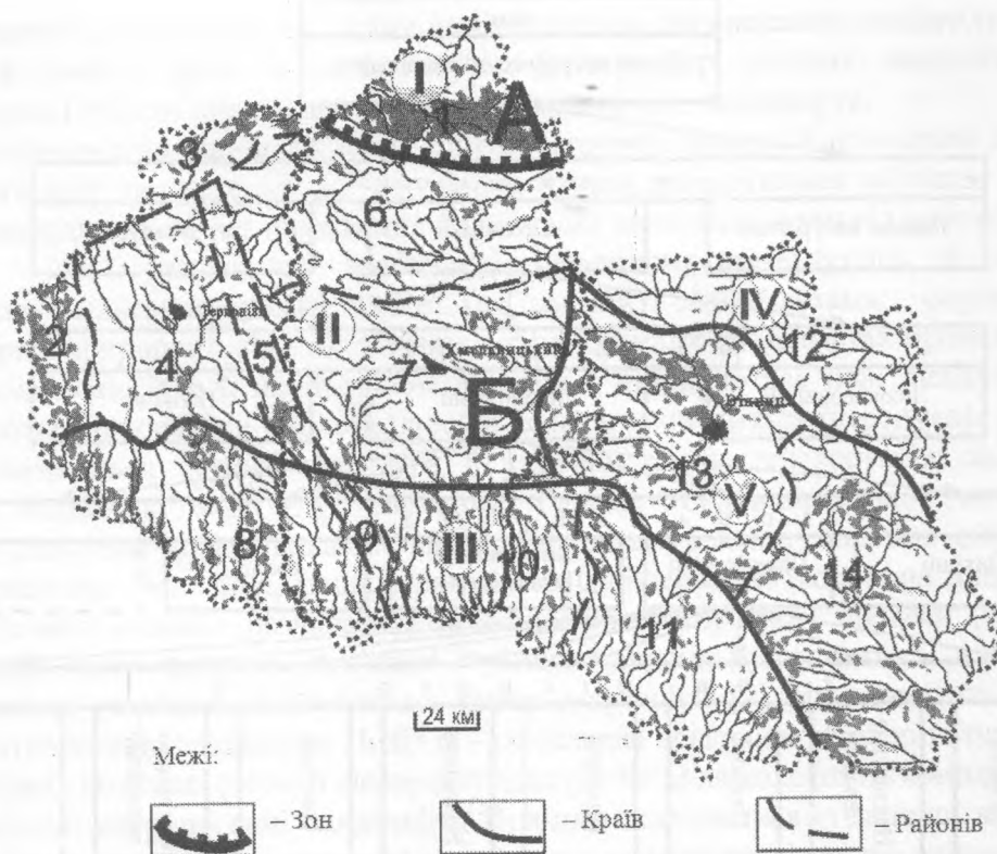
Рис. 2. Районування лісових антропогенних ландшафтів Поділля

Структури. Зональні: А – Лісопасовищна, Б – Лісоцольова. Крайові. I – Малополіська. Райони: 1. Полонський. II – Подільська. Райони: 2. Опільський, 3. Кременецький, 4. Тернопільський, 5. Подільських Товтр. 6. Північно-Подільський, 7. Центрально-Подільський. III – Придністерська. Райони: 8. Заліщицький, 9. Нігинсько-Вербецьких товтр, 10. Ушицько-Лядовецький, 11. Ямпільського Придністер'я. IV – Придніпровська. Райони: 12. Пороський. V – Побузька. Райони: 13. Побузьких полісь, 14. Бузько-Собський.